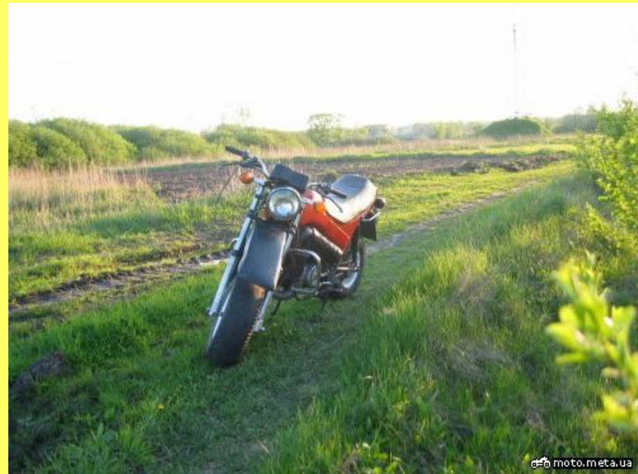
Тула ТМЗ – 5,951

Тула - крупный промышленный центр. Главные отрасли промышленности: чёрная металлургия, машиностроение и металлообработка. Чёрная металлургия представлена Научно-производственным объединением АК "Тулачермет" и Косогорским металлургическим заводом; важнейшие предприятия машиностроения и металлообработки: заводы комбайновый, горного и транспортного машиностроения, оружейный, "Штамп" (мотороллеры, самовары и др.), приборостроительный. Химическая промышленность (главным образом резинотехнические изделия). Разнообразны предприятия лёгкой и пищевой промышленности (чулочно-трикотажная, мебельная, ватная и др. фабрики, сахарный, пивоваренный, ликёроводочный заводы, мясоптицекомбинат и др.); производство гармоней.