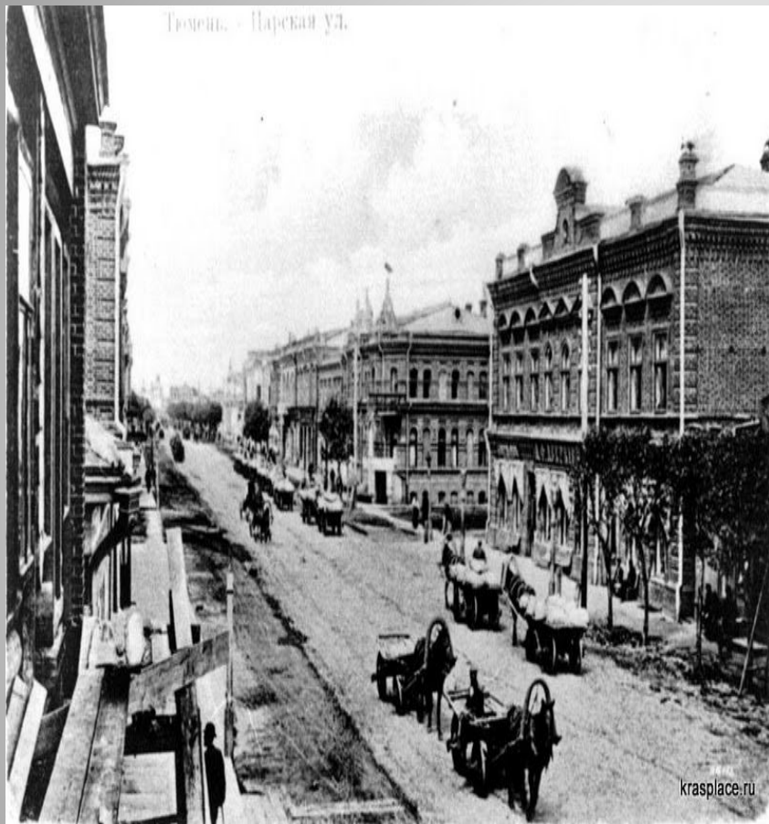
ул. Царская (до 1919 года)