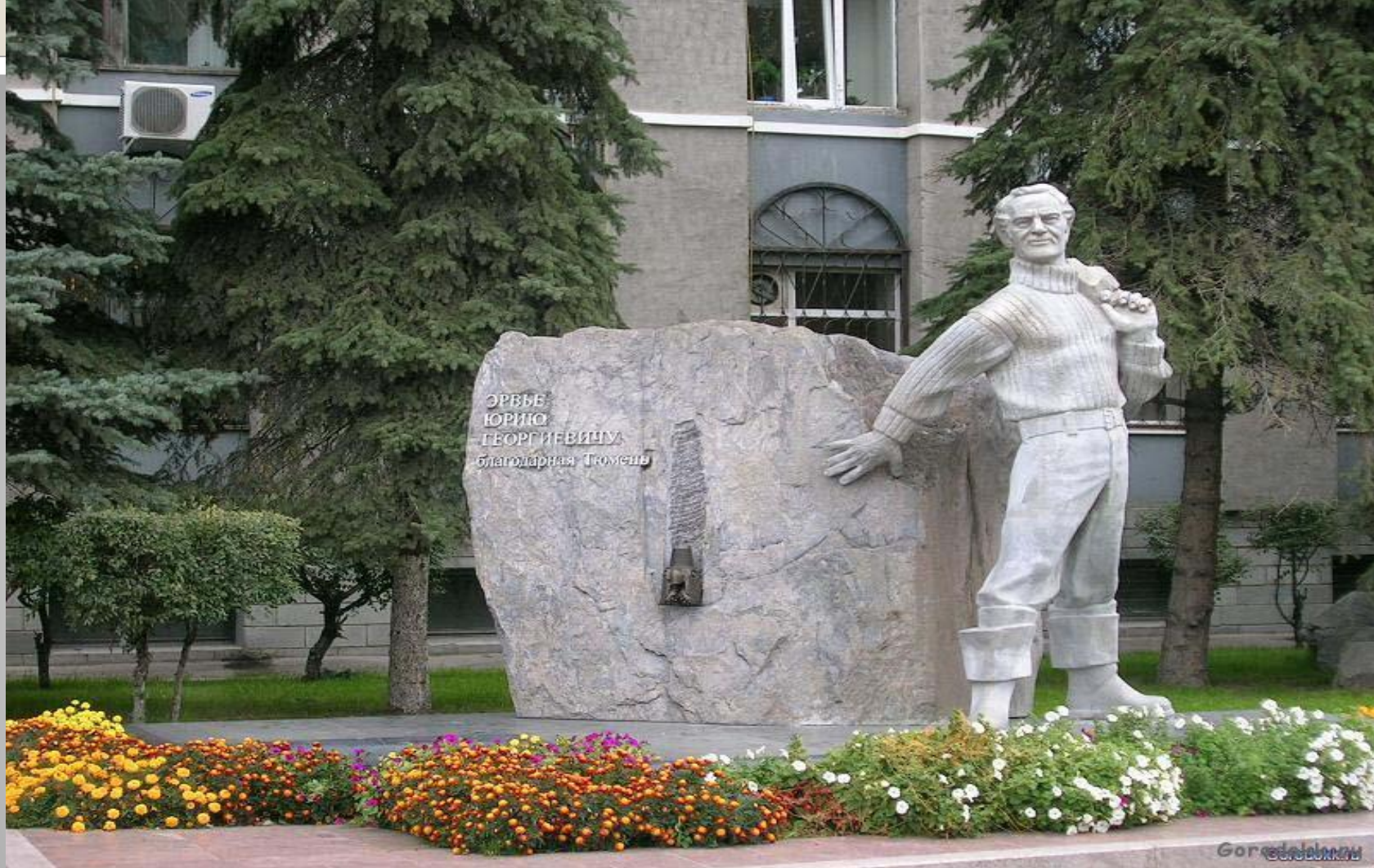
Памятник Эрвье Юрию Георгиевичу - одному из первооткрывателей тюменской нефти