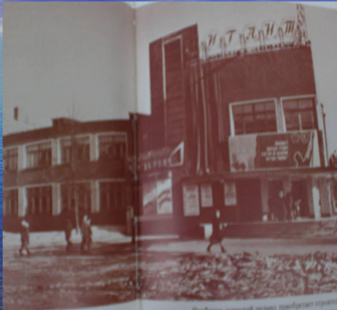
Судомышечный завод приобретает статус