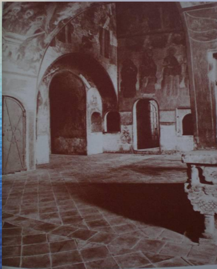
54. Церковь Иоанна Предтечи в Толчкове. 1671–1687. Вид с востока

Крупнейший ярославский храм XVII в. В XVIII в. четырехскатное, более крутое, железное покрытие сменило прежнее,