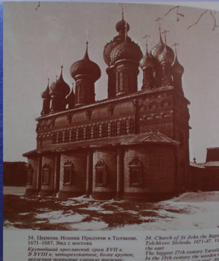
54. Church of St John the Baptist Tolchokovo Sloboda. 1671–87. View the east

Крупнейший ярославский храм XVII в. В XVIII в. четырехскатное, более крутое, железное покрытие сменило прежнее,