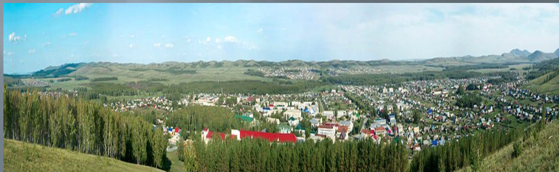
Село Аскарово со стороны горы Алмас-Тау