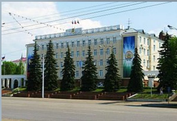
Здание администрации Уфы