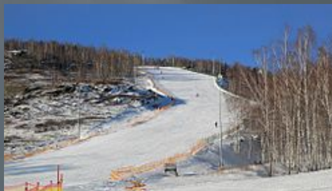
Банное горнолыжный центр