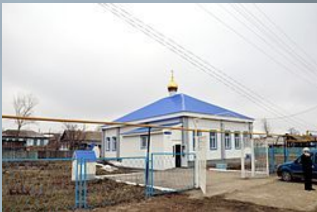
Церковь в Баймаке