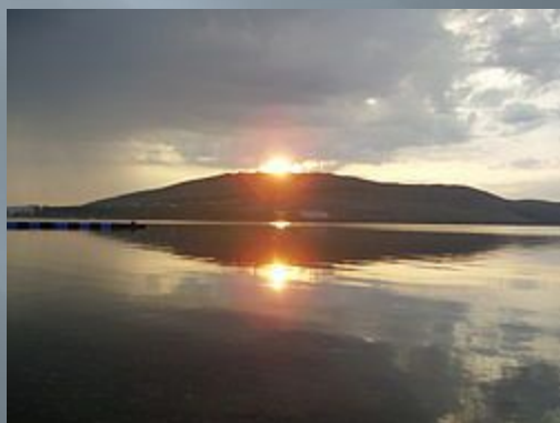
Банное озеро — восход солнца.