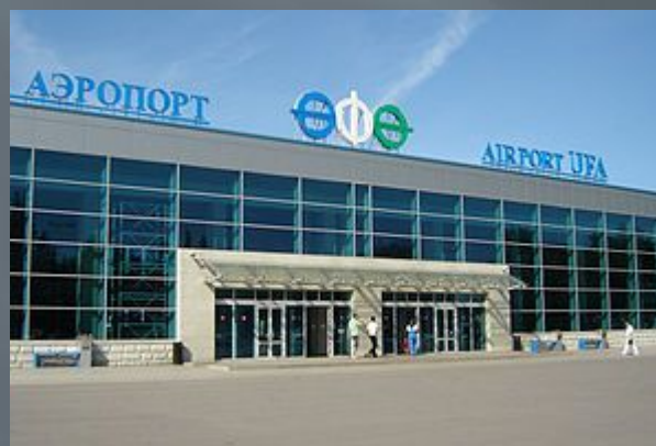
Международный аэропорт «Уфа»