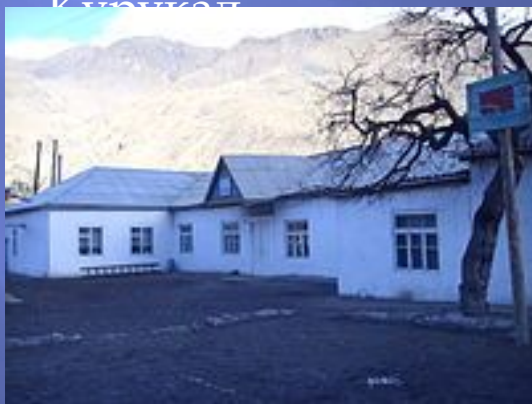
Средняя Общеобразовательная школа в Курукале