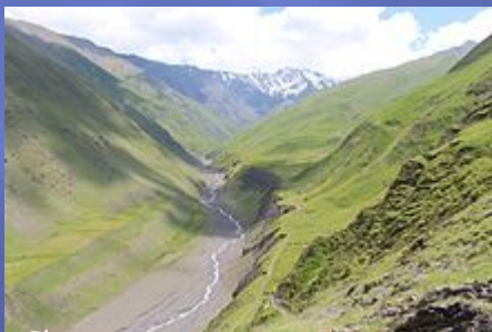
Вид на близлежащую гору Малкамуд с окрестностями села