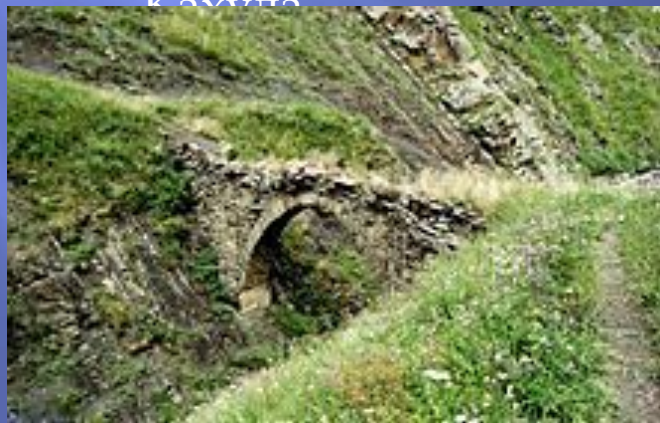
Мост выше Кахула