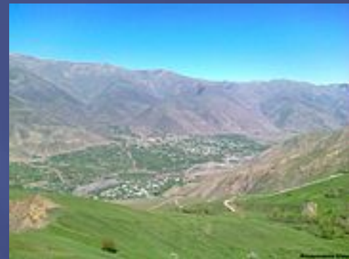
Вид на Луткун