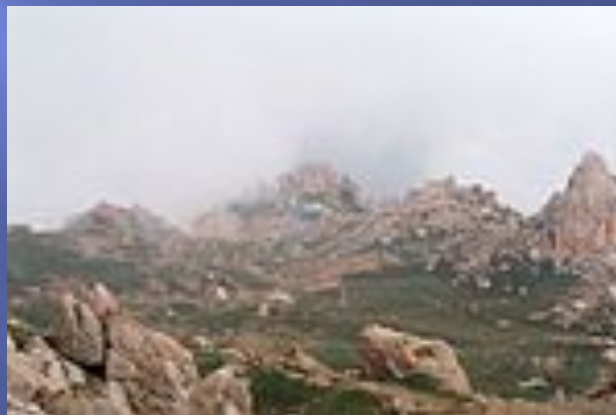
Дом в горах