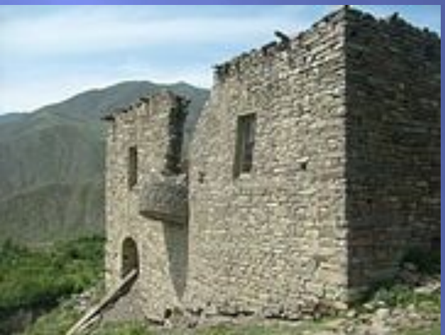
Мечеть в старом селе