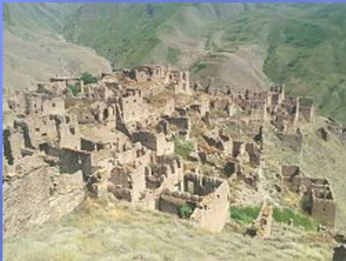
Панорама аула Гра