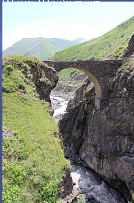
Мост в Фийском ущелье