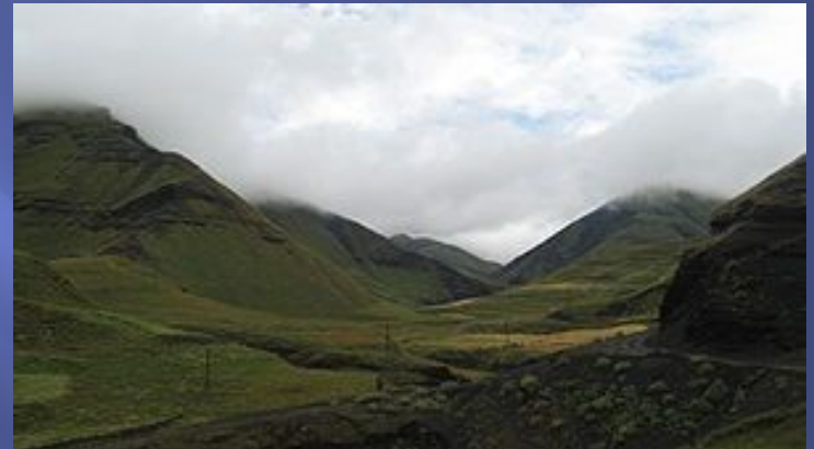
Горы в Агульском районе