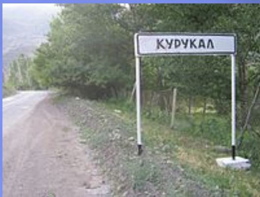
Въезд в село Курукал