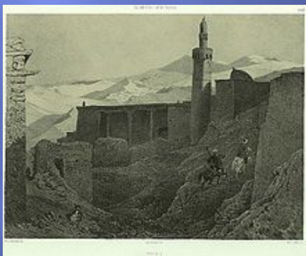
Мечеть в Риче. Рисунок 1840-х годов.