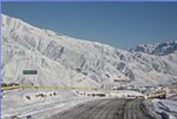
Выезд из Ахтынского района в сторону Докузпаринского