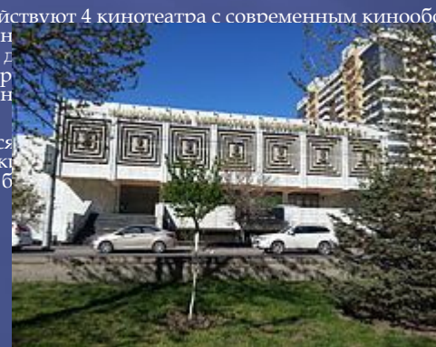
Самым крупным городом-спутником Махачкалы