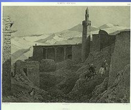
Мечеть в Риче. Рисунок 1840-х годов.