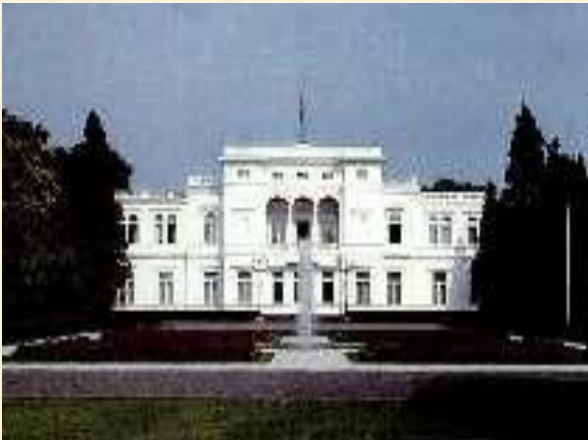
Резиденция федерального президента

В городе находится здание парламента – бундестага, резиденция главы правительства – дворец Шаумбург, административные здания виллы посольств.