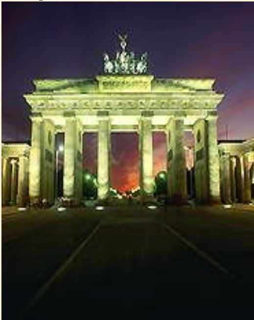
Бранденбургские ворота в историческом центре Берлина