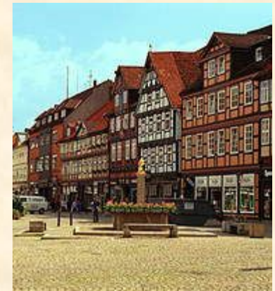
Старинные дома Эрфурта