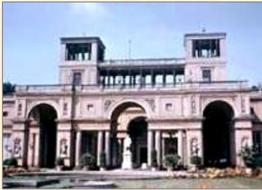
Дворец в Сан-Суси

Название Потсдам впервые упоминается в X в. С конца XVIII в. был второй резиденцией прусских королей. В Потсдаме проходила конференция глав правительств СССР, США и Великобритании — Потсдамская (Берлинская) конференция 1945 года (во дворце Цецилиенхоф).