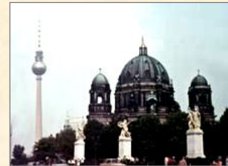
Берлинский собор. На заднем плане – Берлинская телебашня на Александрплац