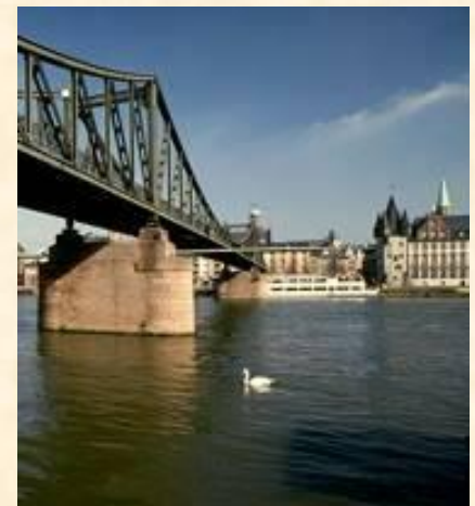
Мост через Майн