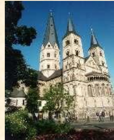
Кафедральный собор XI-XIII вв.