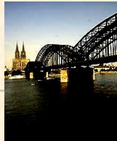
Мост через Рейн

Кельнский собор. Здание строилось в 1248-1560 гг., а в 1842-80 гг. было окончательно закончено. Завершение строительства стало символом национального возрождения Германии.