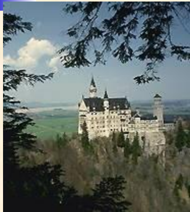
Старинный замок в Баварии