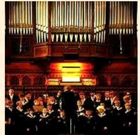
Хор в церкви Томаскирхе