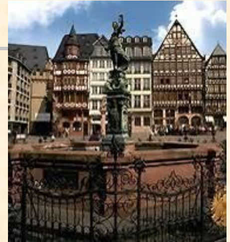
Исторический центр города

Франкфурт-на-Майне - крупный финансовый и торговый центр. Международный аэропорт «Рейн-Майн». Крупный университет и научно-исследовательские институты атомных исследований. Родина И. В. Гете. Известен с конца VIII в. Знаменит готическим собором XIII-XVI вв. и ратушей XV-XVIII в