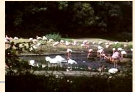
Фламинго в Берлинском зоопарке