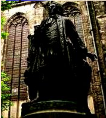
Памятник композитору И.С.Баху

Лейпциг - крупный промышленный и торговый центр Германии, здесь проводятся ежегодные международные ярмарки, пушные аукционы, расположен международный аэропорт.