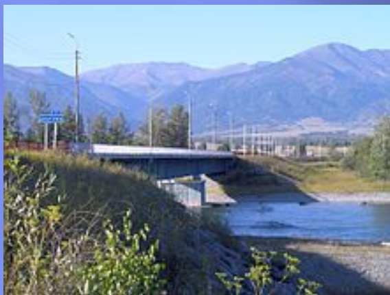
Мост через Катунь вблизи села Верх-Уймон