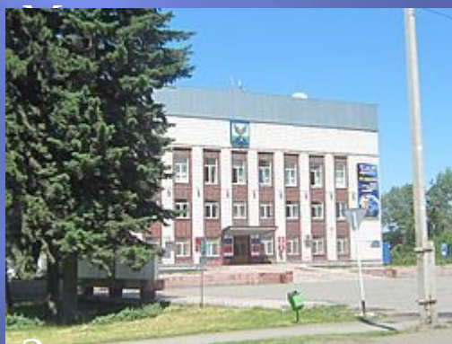
Здание администрации Майминского района