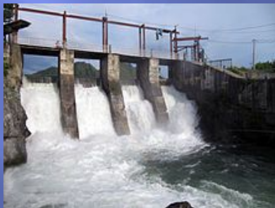
Чемальская ГЭС в 2011 году