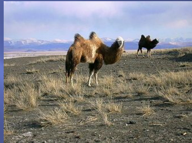
Кош-Агачский район, Чуйская степь