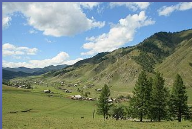
Вид села Верхняя Апшухта