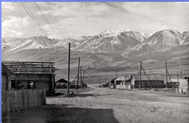
Курай. Кош-Агачский район. Алтай. СССР. Фото 1989 года.