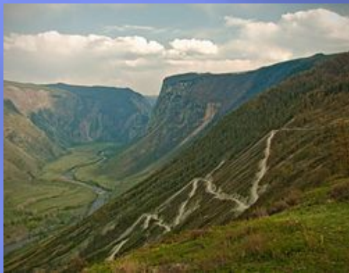
Перевал Кату- Ярык