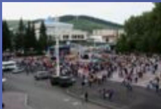
Празднование 250-летия вхождения Алтая в состав России на площади им. В. И. П.