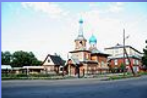
Храм Покрова Пресвятой Богородицы