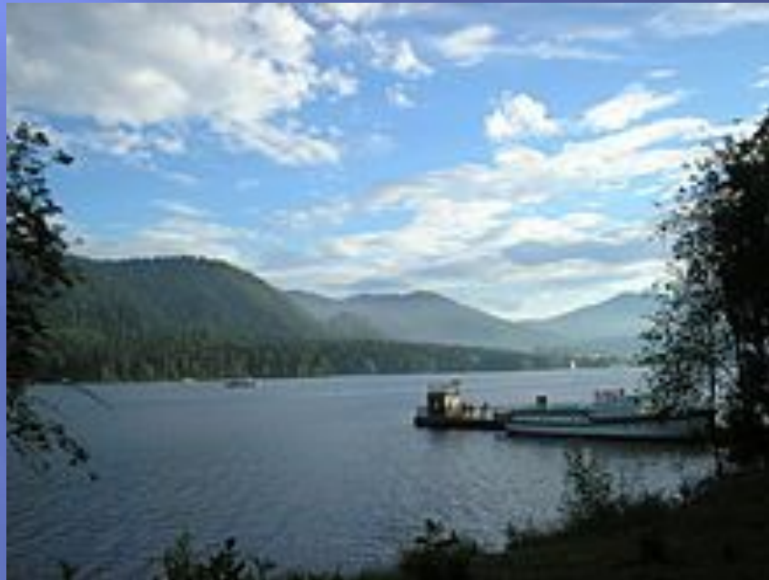
Телецкое озеро в Турочакском районе