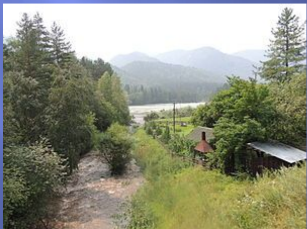
Впадение реки Муны в Катунь, с. Усть-Муны