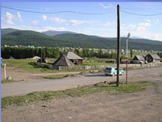
Село Усть- Улаган