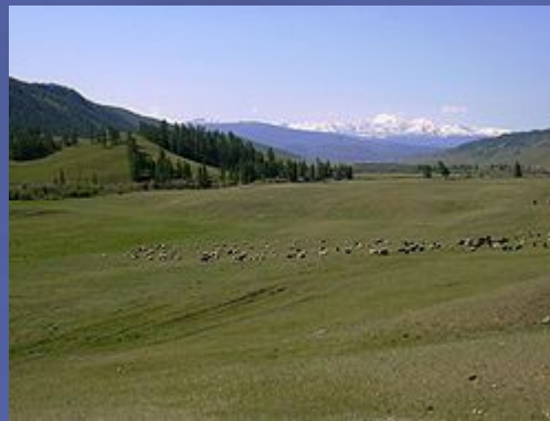
Один из примеров пенеплена на территории района