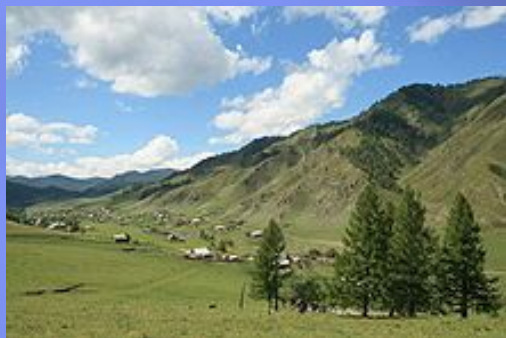
Вид на село