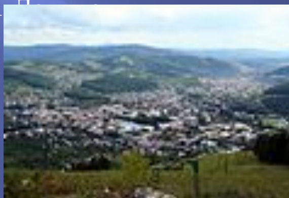
Панорама Горно-Алтайска, вид с горы Тугая