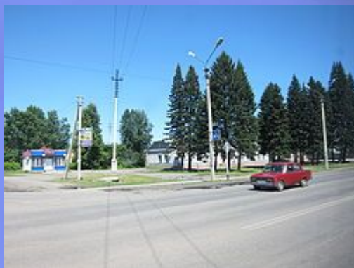
Чуйский тракт в