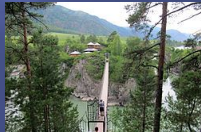
Подвесной мост, ведущий на остров Патмос