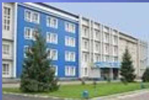
Горно-Алтайский государственный университет