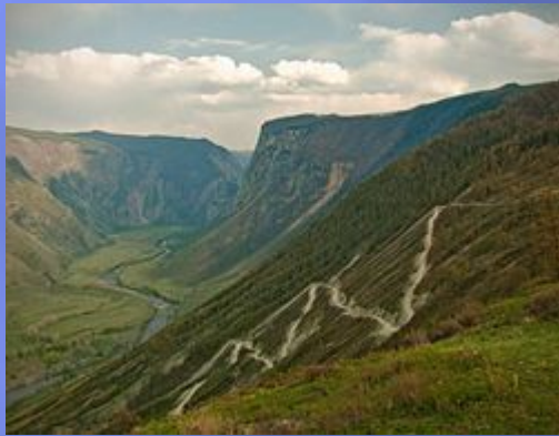
Перевал Кату- Ярык