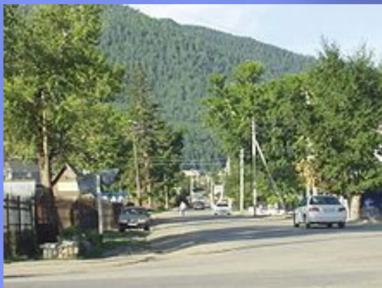
На улицах Онгудая