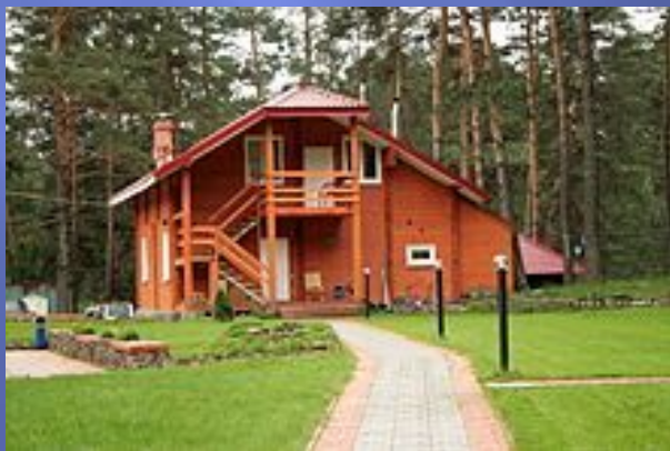
Один из корпусов парк-отеля «Манжерок»