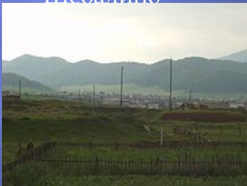
Панорама села Шебалино