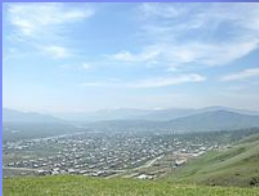
Вид на село с Теректинского хребта