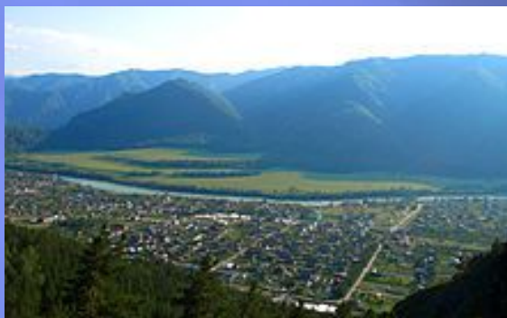
Вид на Чемал с