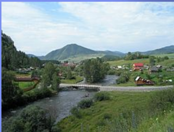
Вид на Камлак с Чуйского тракта при въезде в село