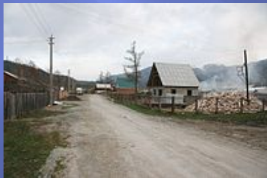
Утро в Усть-Коксе