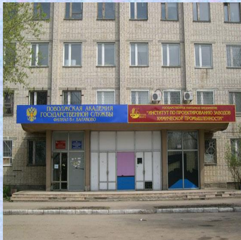
ПОВОЛЖСКАЯ АКАДЕМИЯ ГОСУДАРСТВЕННОЙ СЛУЖБЫ