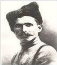
Чапаев Василий Иванович (1887-1919)