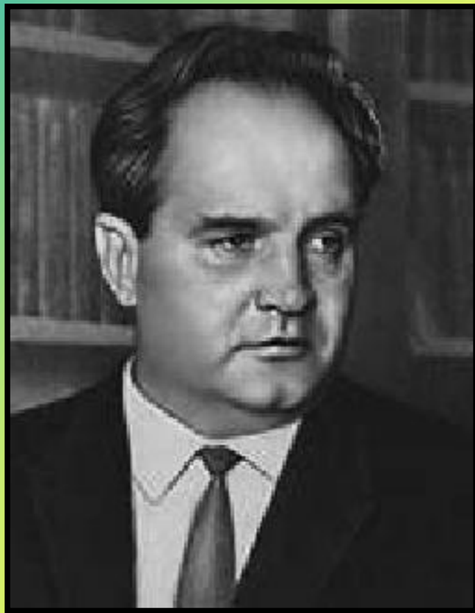
Сергей Сергеевич Наровчатов

В честь какого знаменитого академика названа одна из улиц города?