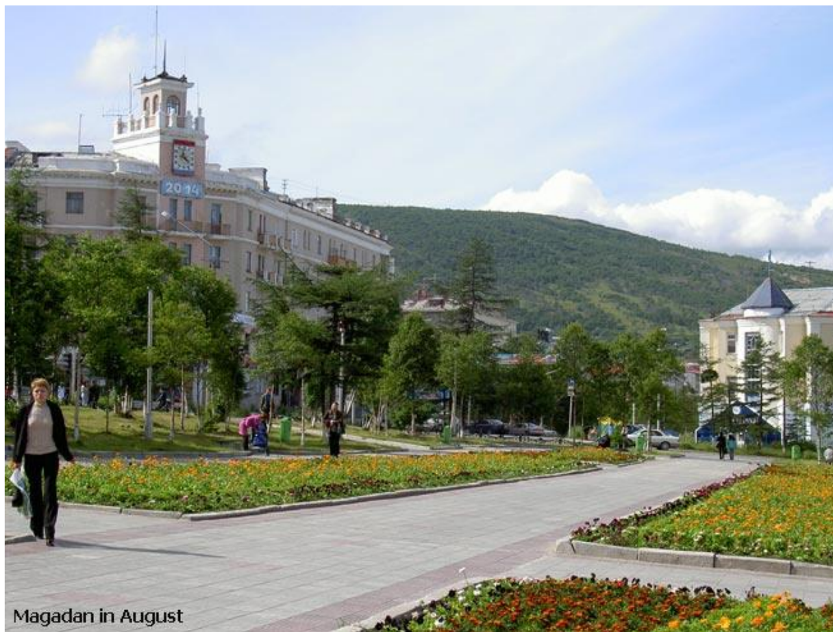
Magadan in August