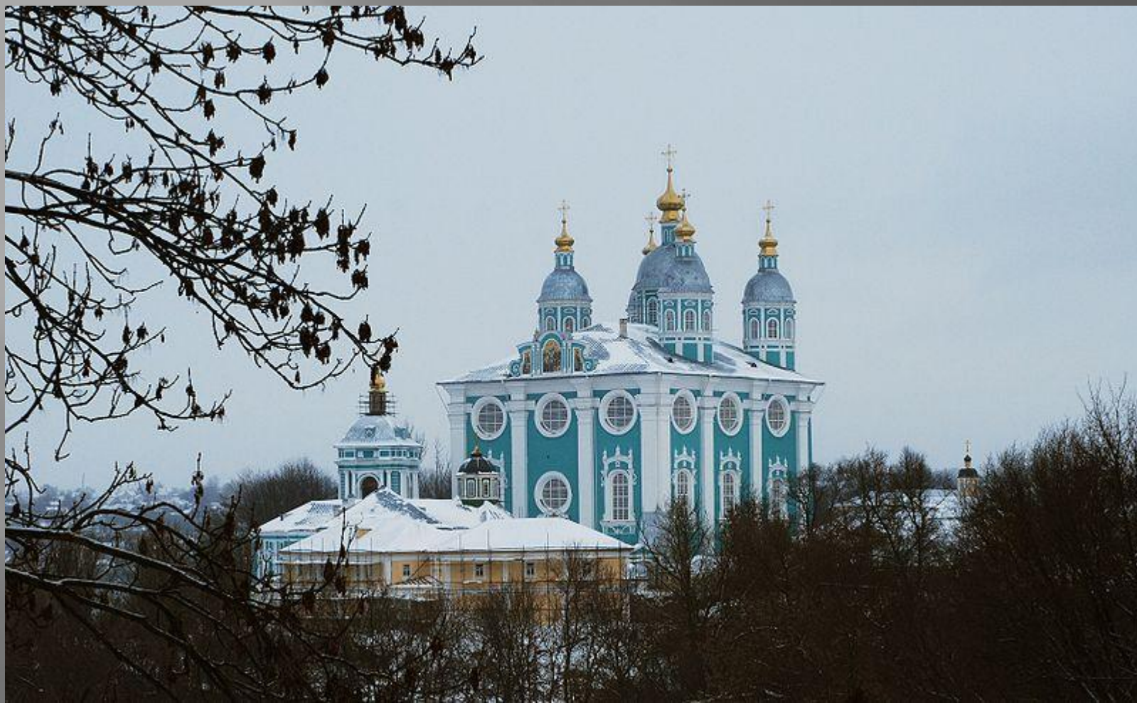
Храмы Соборной горы