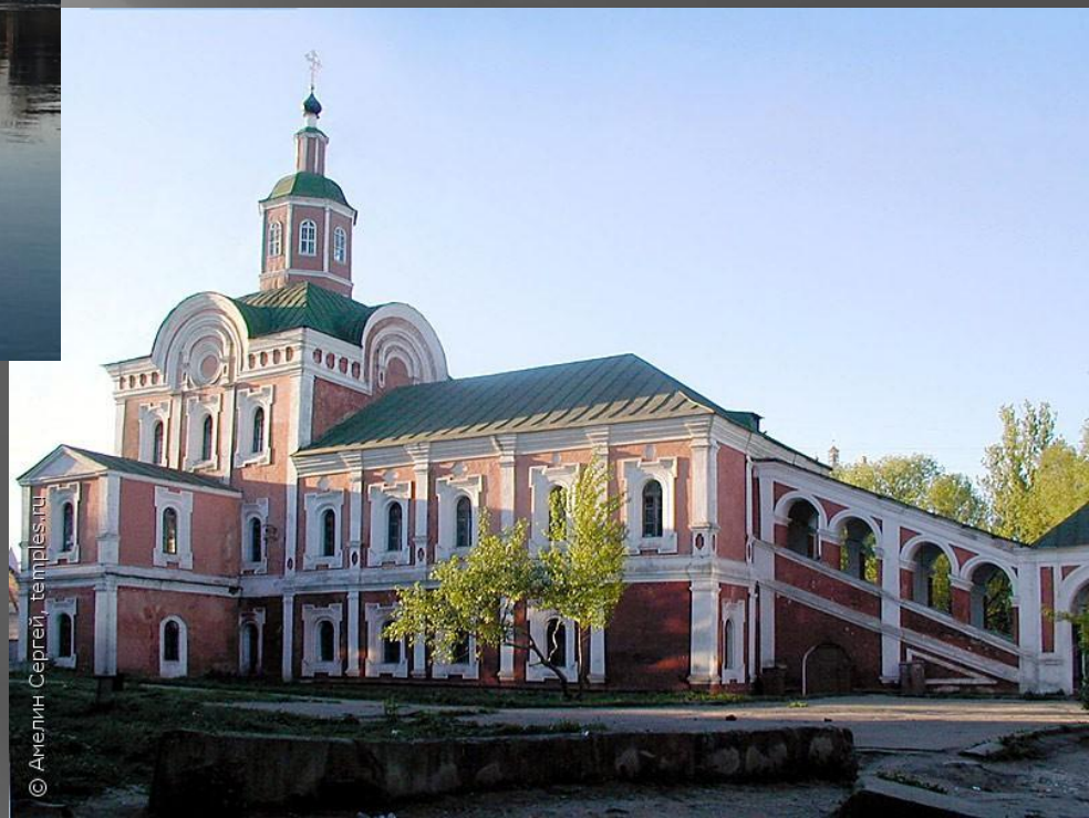
Церковь Николая Чудотворца