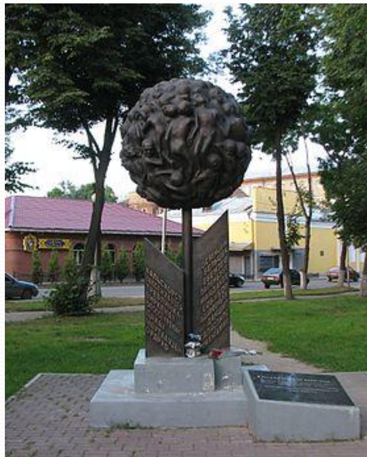
«Опалённый цветок» — памятник детям — узникам фашистских концентрационных лагерей.