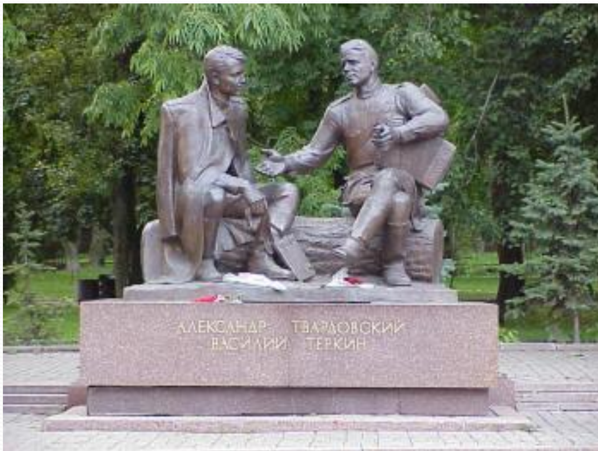
Памятник Александру Твардовскому и Василию Тёркину