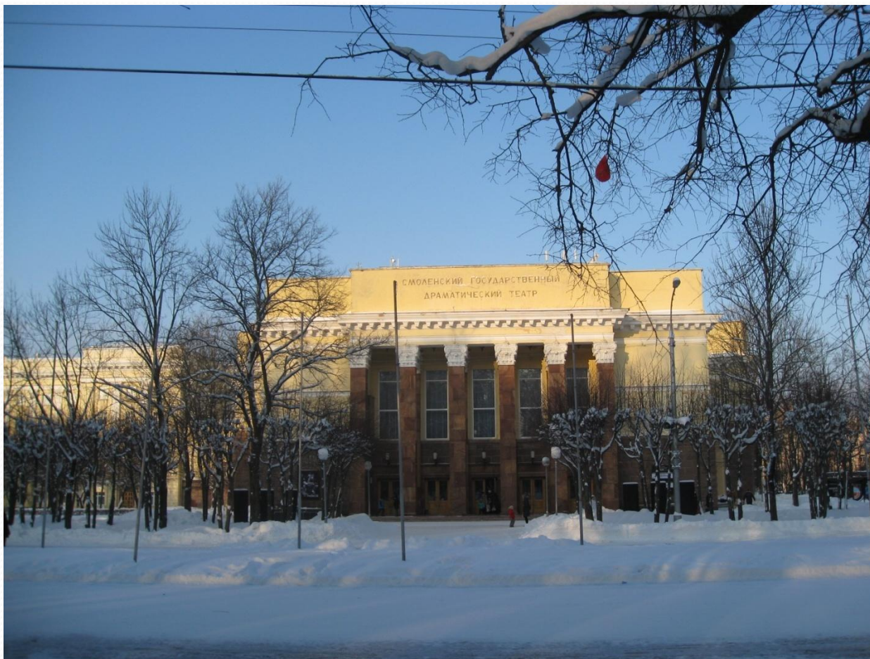
Смоленский государственный драматический театр имени А.С. Грибоедова.