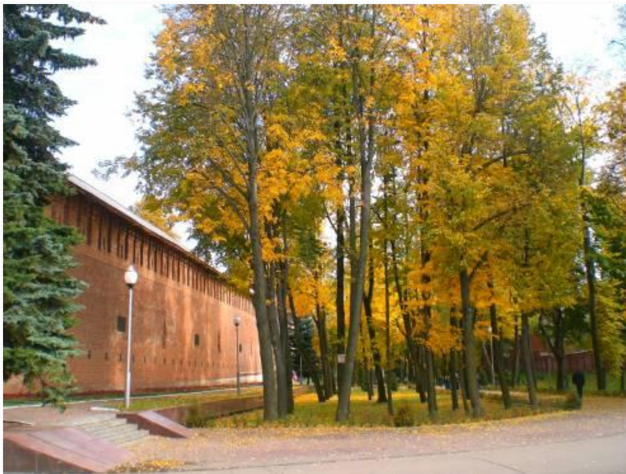
Сквер Памяти Героев