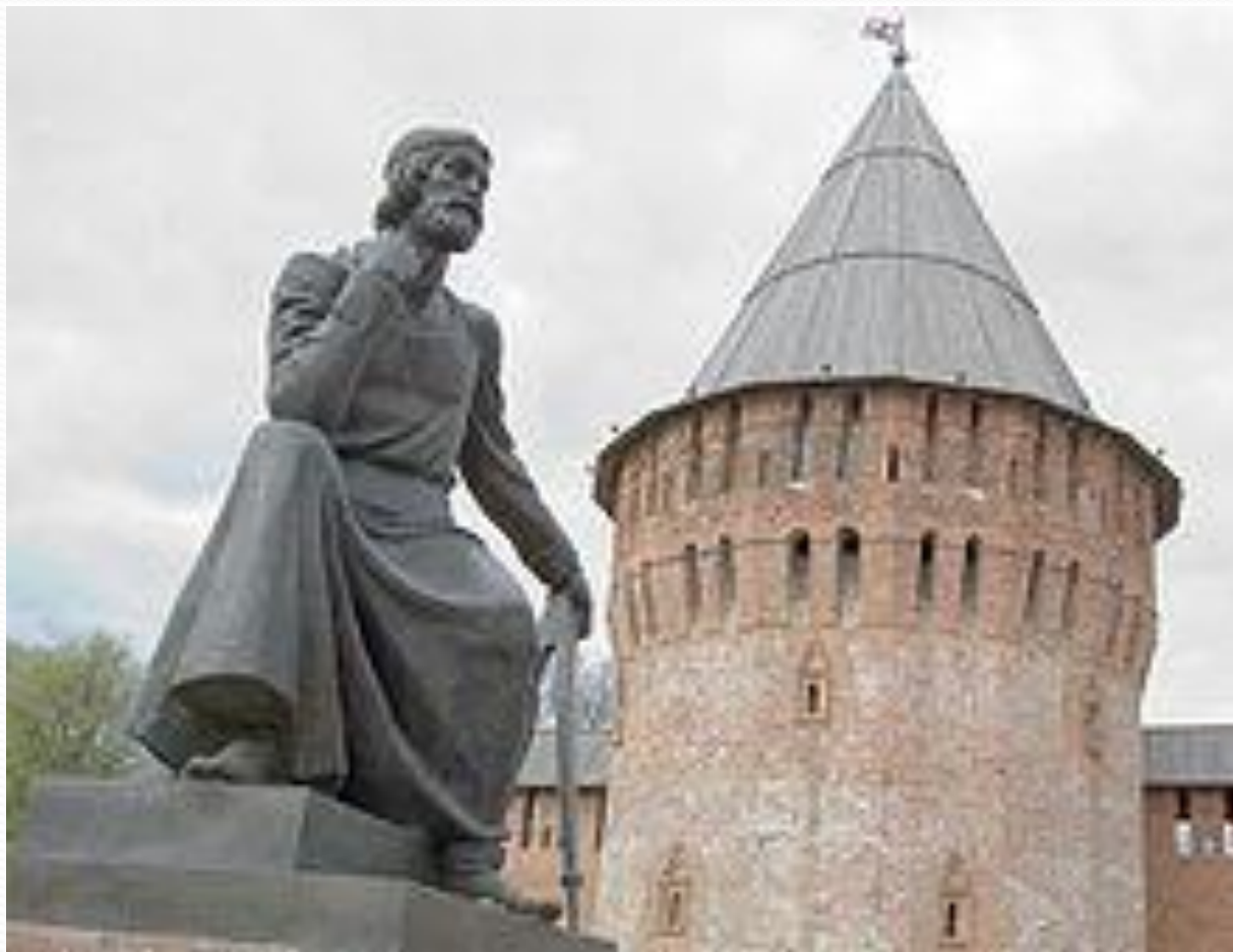
Памятник Фёдору Коню