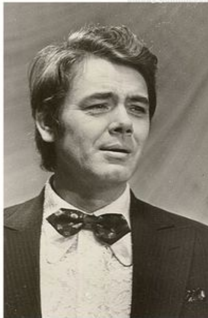
Ю.А. Гуляев (1930 – 1986)

Огромную славу городу и области принес Юрий Александрович Гуляев, оперный и эстрадный певец, композитор, Народный артист СССР. Певец много гастролировал по Советскому Союзу, а также в Австрии, Швейцарии, Бельгии, Франции, Чехословакии, Венгрии, Болгарии, ГДР, Канаде, США, на Кубе, в Польше, Югославии, Японии и других странах.