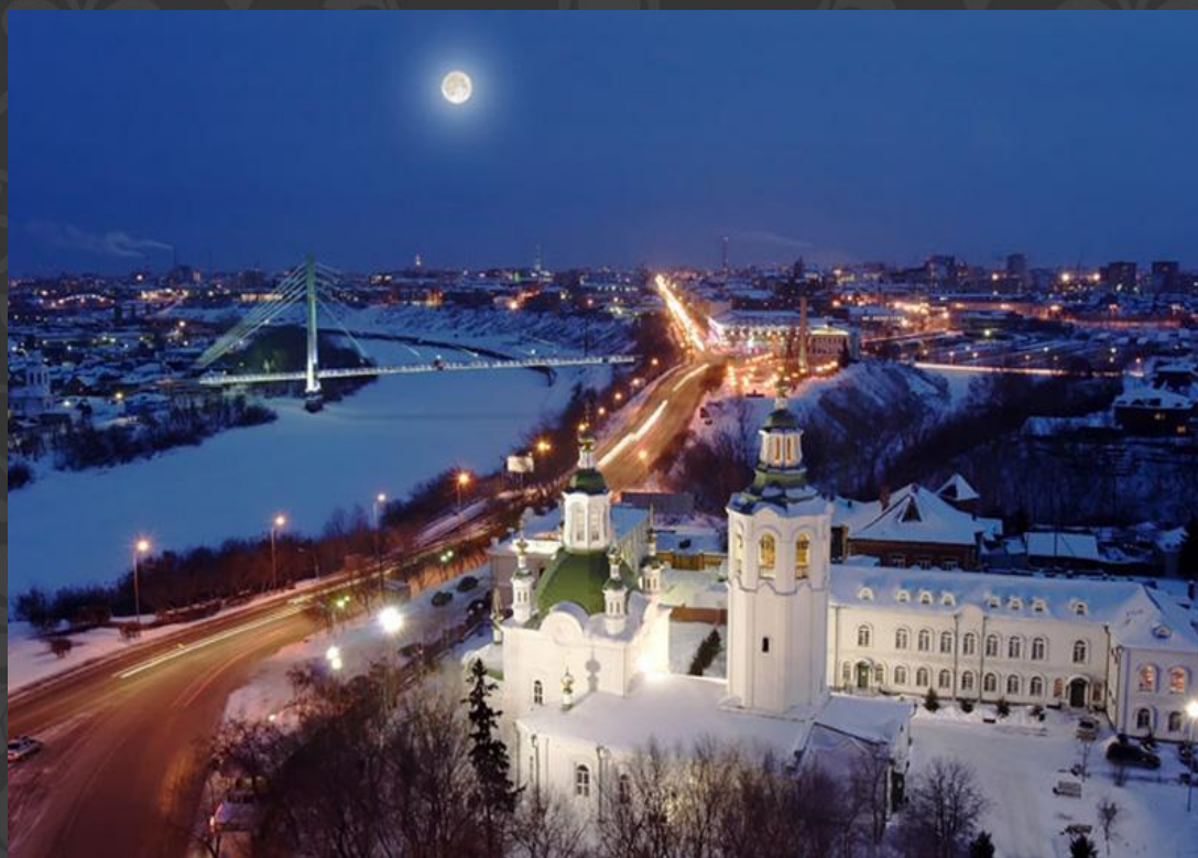
Вид на Троицкий монастырь в городе Тюмень

Тюмень была построена в выгодном месте – на реке Туре. С помощью этого русские люди начали активно торговать с Северными и Восточными землями. В 1618 году монах Нифонт основал в Тюмени Троицкий монастырь, который существует и по сей день.