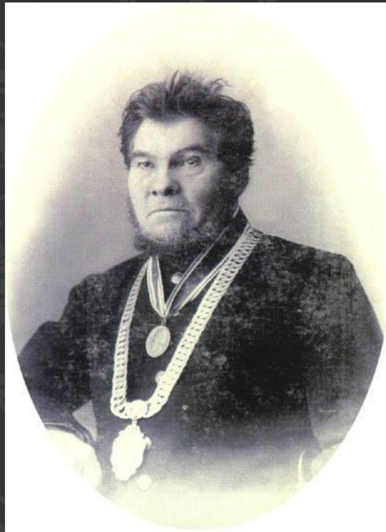
А.И. Текутьев (1839 – 1916)

Тюмень всегда славилась своими гражданами. Одним из них был купец Андрей Иванович Текутьев, который сыграл значительную роль в развитии города Тюмень. В 1899 г. он стал городским головой Тюмени и эту должность занимал до 1911 года. Он финансировал облагораживание улиц Тюмени и укрепление набережной Туры. В 1892 г. он на свои средства построил каменный театр и содержал его до конца жизни. В 1899 г. он открыл городскую библиотеку, построенную в честь столетия со дня рождения А. С. Пушкина. В 1899 г. он отдал верхний этаж своего дома на углу улиц Водопроводной и Хохрякова для размещения трех народных училищ. Бедным ученикам он оказывал финансовую помощь, платя по 200 рублей в год.