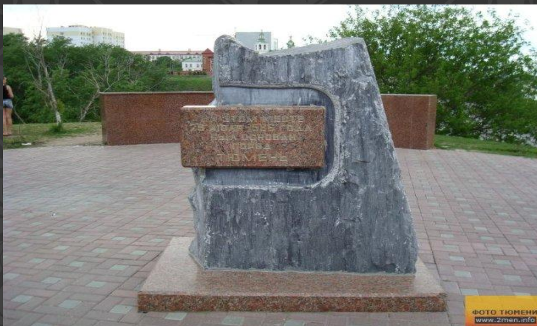
Памятный камень на месте где начинал строиться Тюмень

До сих пор идут споры, что же означает название города. Считается, что оно произошло от татаро-монгольского слова «ТУМЕН», что означает десять тысяч. Некоторые считают, что слово происходит от угорского слова «ЧЕМГЕН» - город на пути.