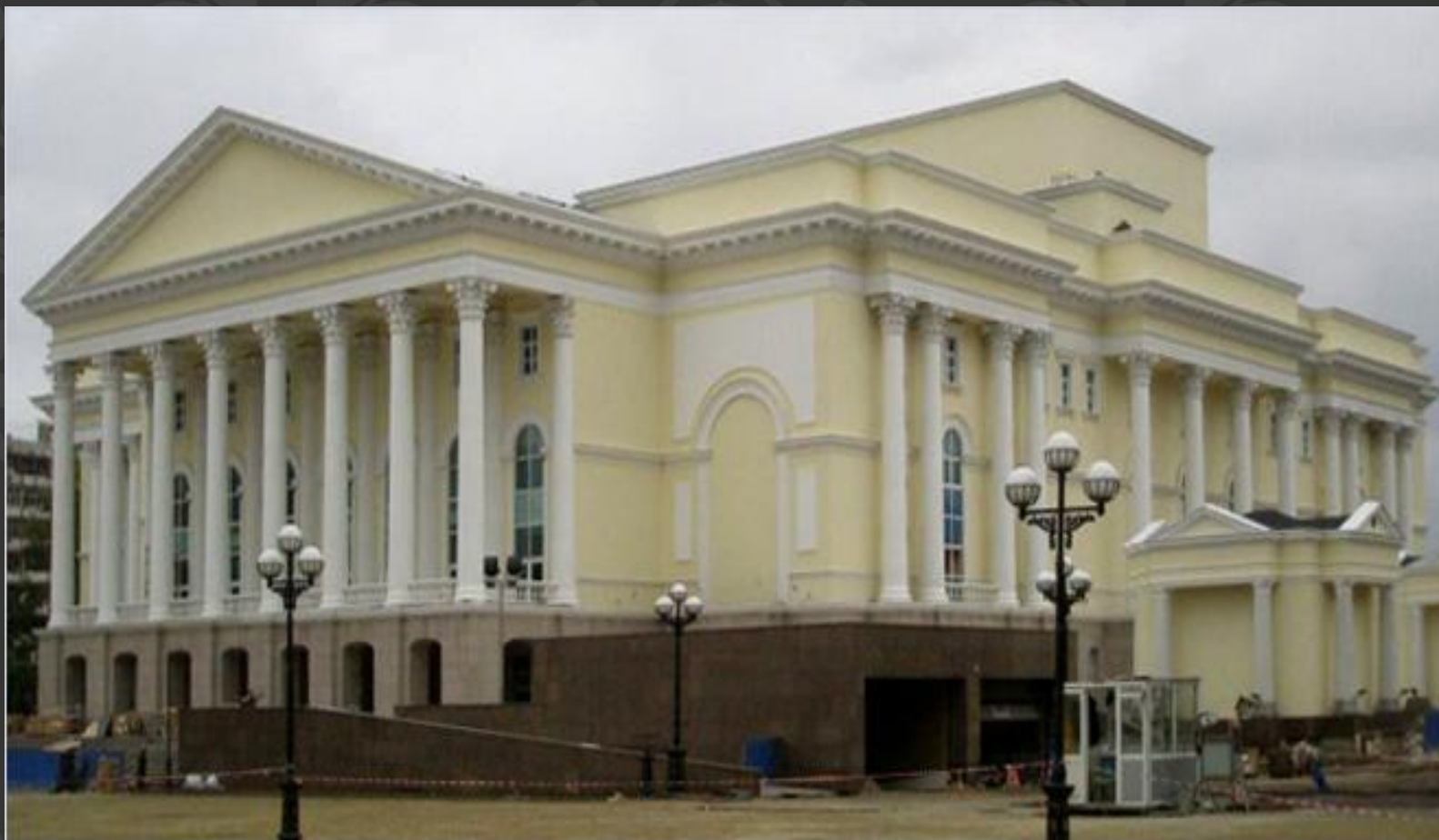
Тюменский Драматический театр (новое здание). Старое здание было построено в 1858 году.