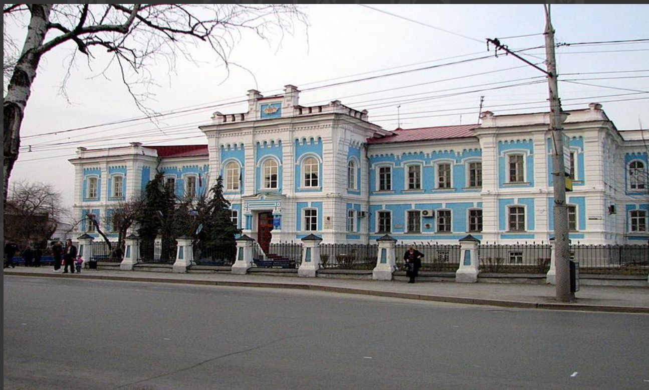
Здание Тюменской государственной с/х академии

В годы Великой Отечественной войны 1941 – 1945 гг. В Тюмень были эвакуированы многие промышленные предприятия, но самым примечательным фактом является то, что в Тюмень во время войны было перевезено тело В.И. Ленина. Функции мавзолея исполняло здание нынешней Тюменской государственной сельскохозяйственной академии.