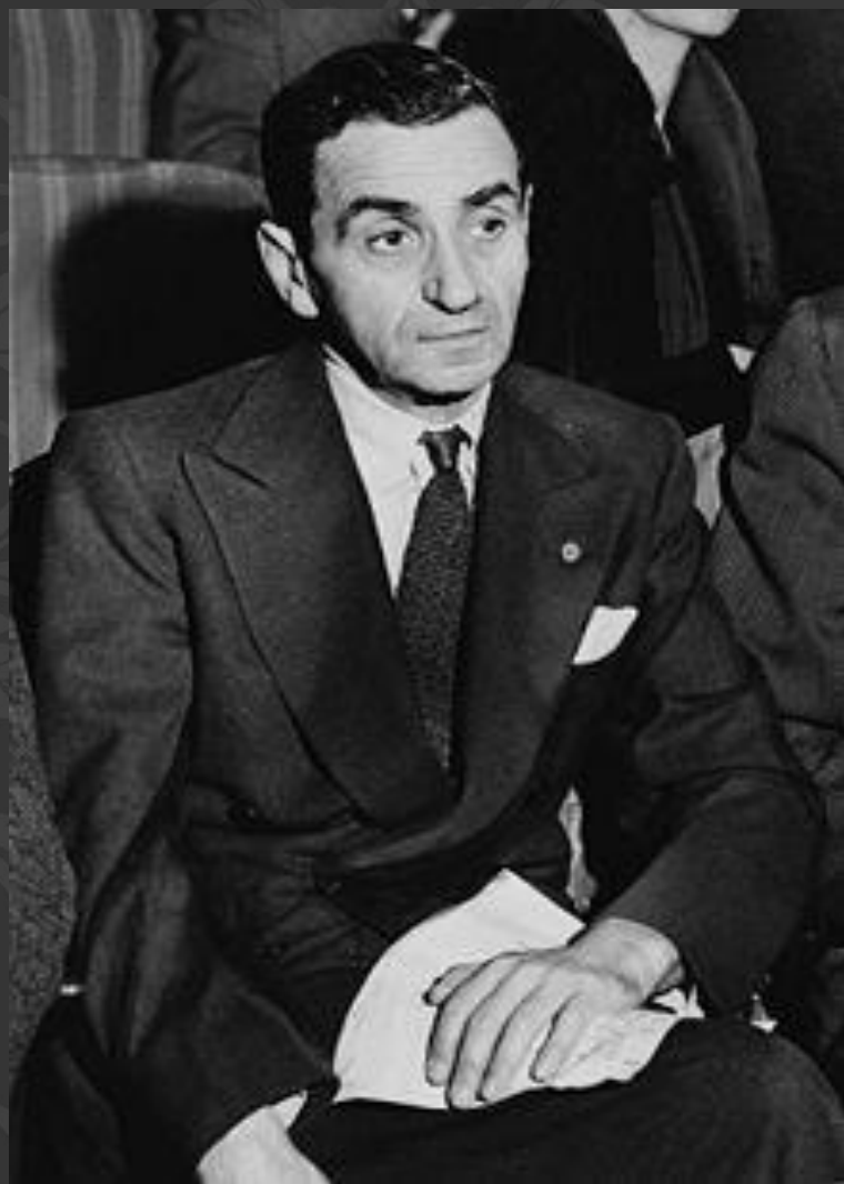
Ирвинг Берлин (1888 – 1989)

Известный американский композитор И. Берлинг родился в Тюмени в еврейской семье. За свою жизнь И. Берлин создал полторы тысячи песен (из которых 50 считаются хитами), написал музыку для 19 театральных постановок и 15 фильмов. Первое признание композитору принесла песня «Александр рэгтайм бенд».