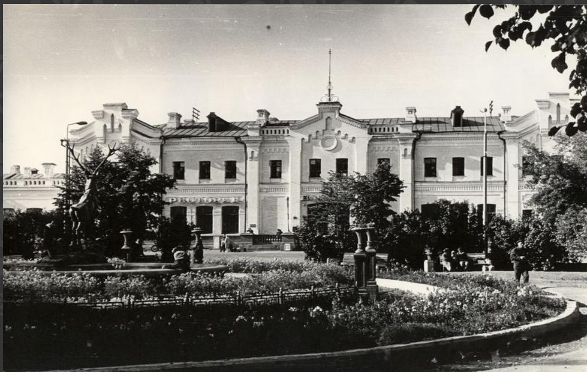
Старое здание ж/д вокзала в г. Тюмень (построен в 1885 году)

С 1845 года до начала XX века в Тюмени ежегодно проводилась крупная Васильевская ярмарка, на которую приезжали даже купцы из Азии. Однако, Тюмень начинает активно развиваться только в XIX веке, когда через нее стала проходить Транссибирская железнодорожная магистраль.