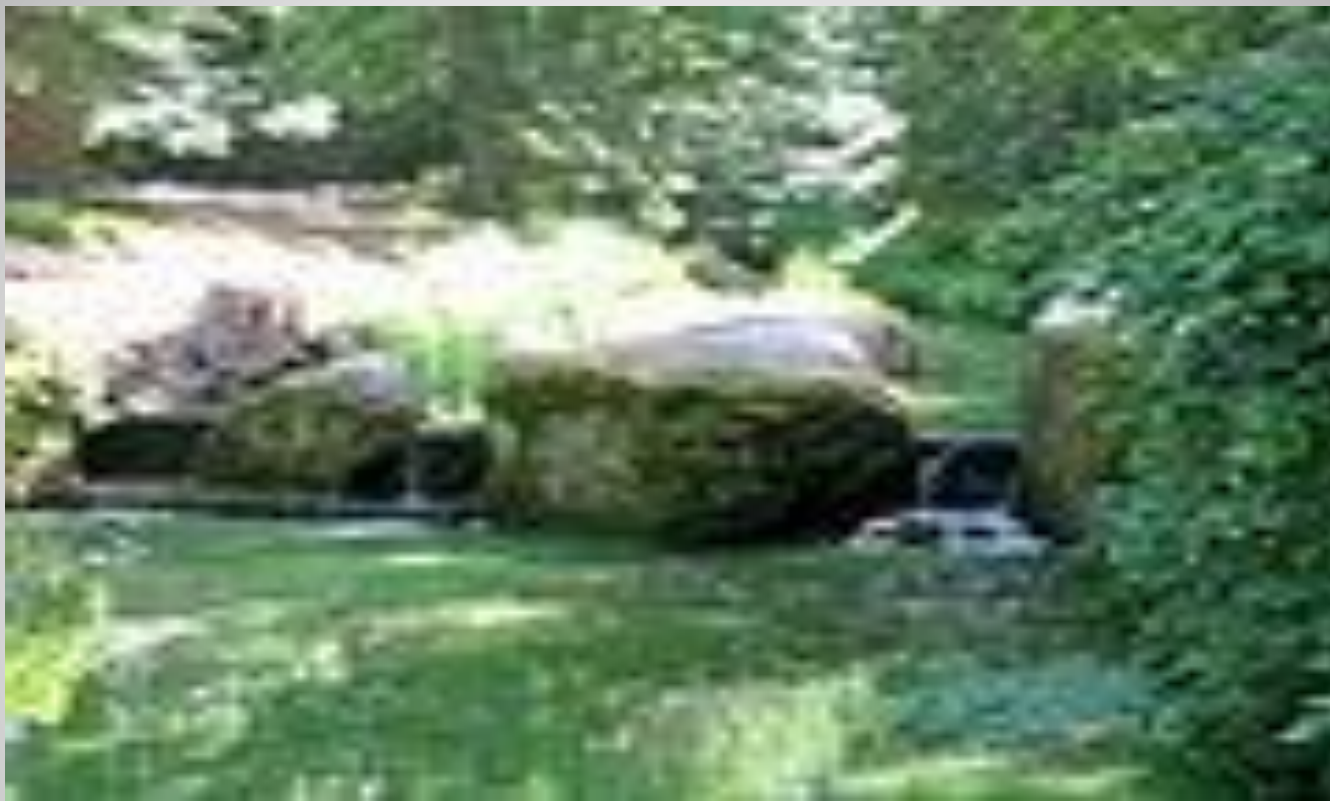
Водопад «Три слезы»