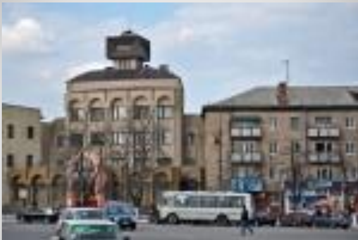
Город Умань Черкасской области, Украина