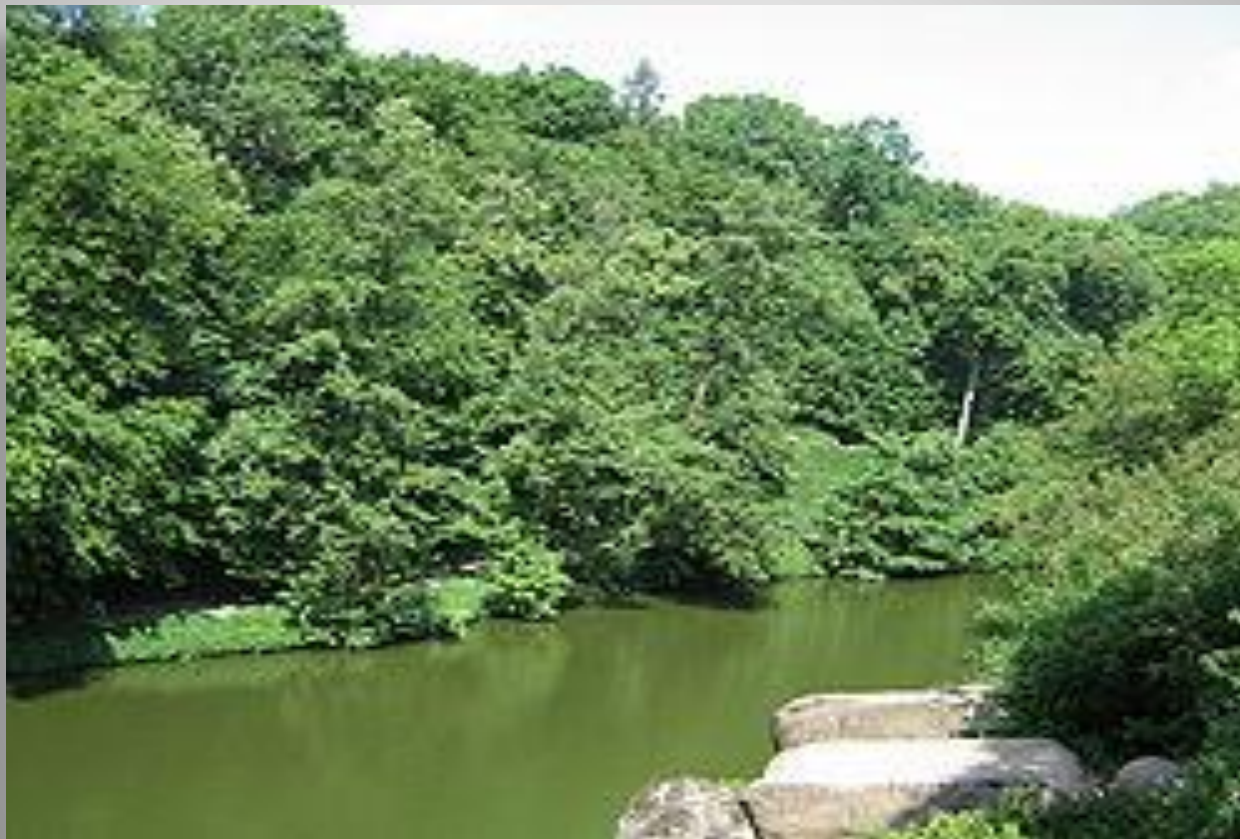
Вид на Нижнее озеро