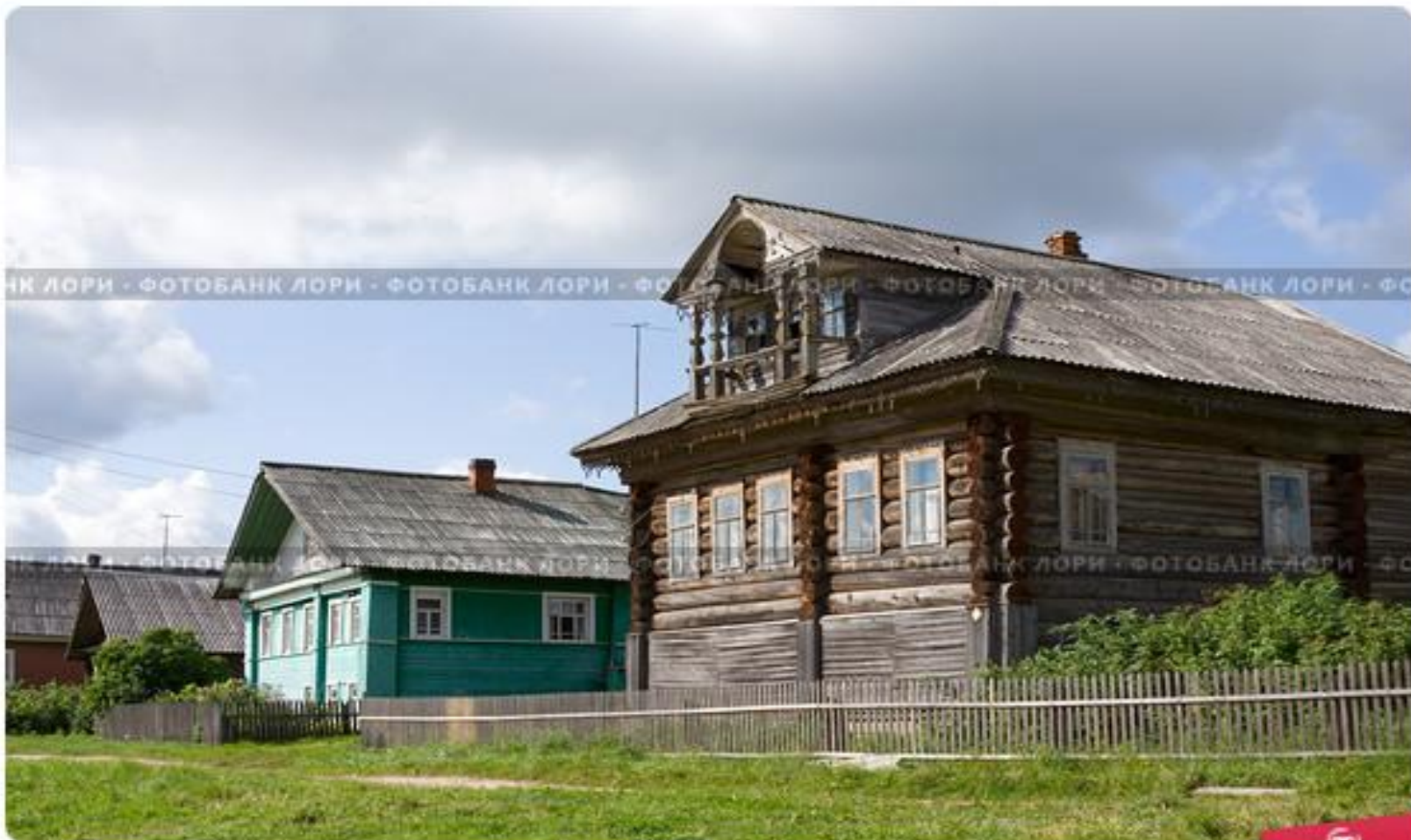
Традиционные деревенские дома на Русском Севере