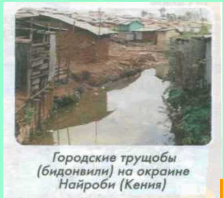
Городские трущобы (бидонвили) на окраине Найроби (Кения)

Ложная или трущобная урбанизация – резкое увеличение доли городского населения в развивающихся странах за счет притока сельского населения и образования вокруг крупных городов стихийных поселений, лишенных инфраструктуры.