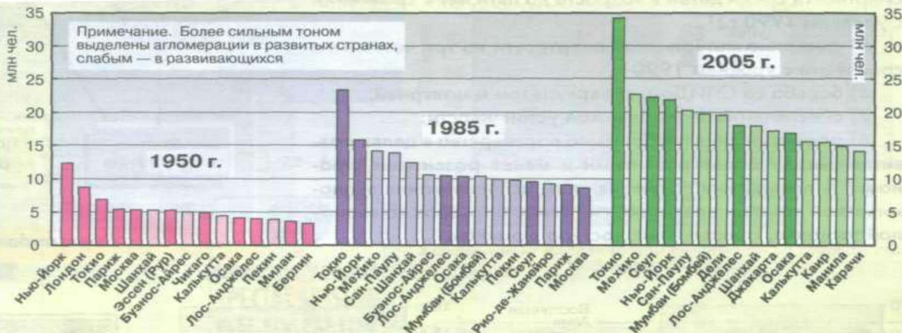
Пятнадцать первых по численности агломераций мира, 1950, 1985, 2005 гг.