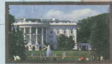
Белый дом — резиденция президента США в Вашингтоне

ЗАДАНИЕ 6. Найди эти мегалополисы на карте. Нанеси их на контурную карту.