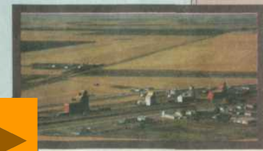
Типичный пейзаж в «пшеничном поясе» США