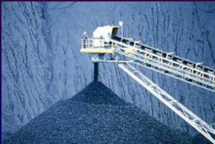
Добыча каменного угля