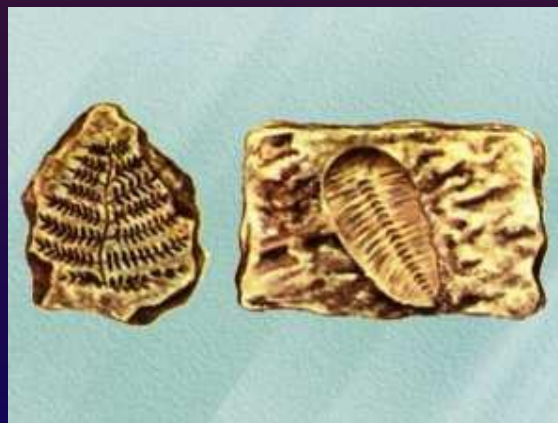
Отпечатки древних растений и древних животных