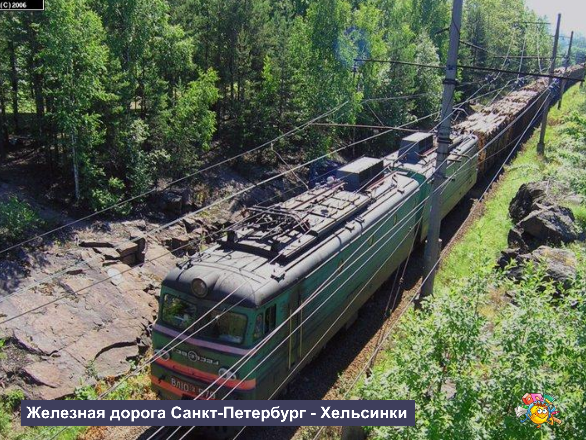
Железная дорога Санкт-Петербург - Хельсинки