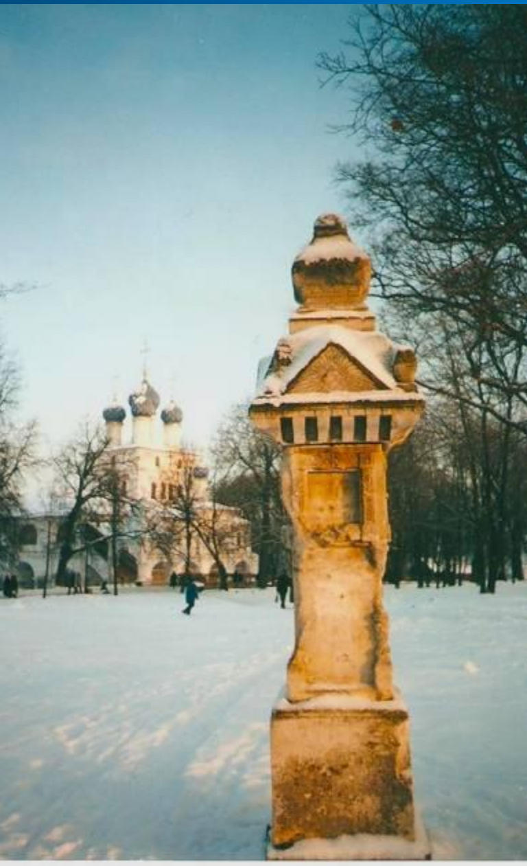
Древний пограничный столб