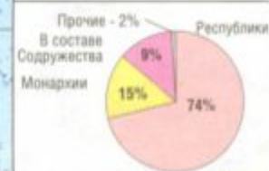
Соотношение стран мира с разными формами территориально-государственного устройства