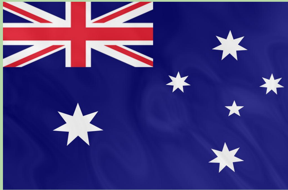
Государственный флаг Австралии

Страус эму и кенгуру изображены на государственном гербе Австралии