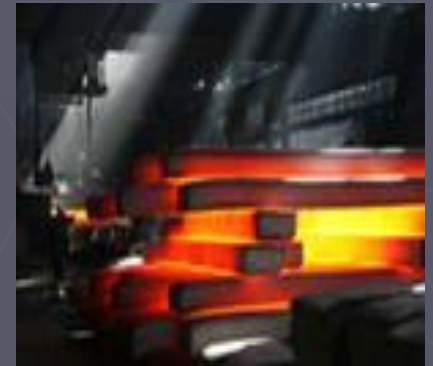
чёрная и цветная металлургия