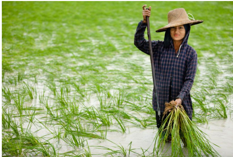
Рисовые плантации Мьянмы