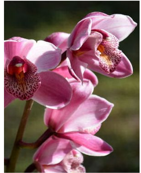
Мьянманские орхидеи (в Мьянме растёт 841 вид)