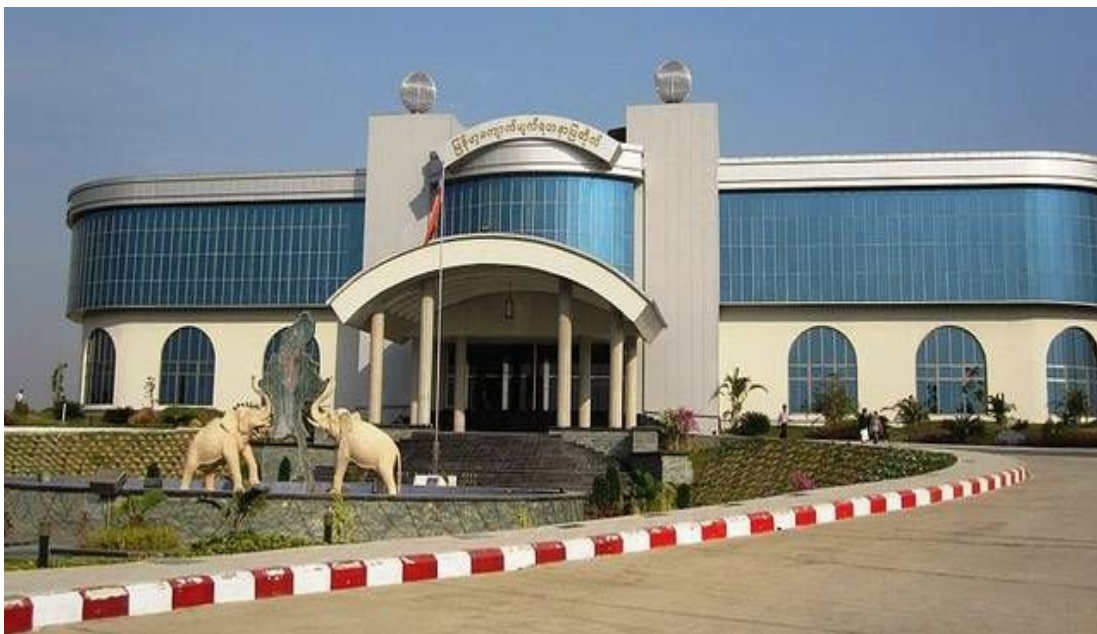
Музей драгоценных камней