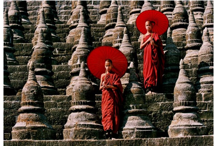
Мьянма, древний город Мраук-У