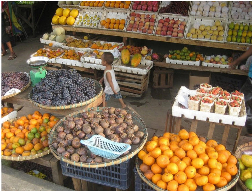
Рынок в Мьянме