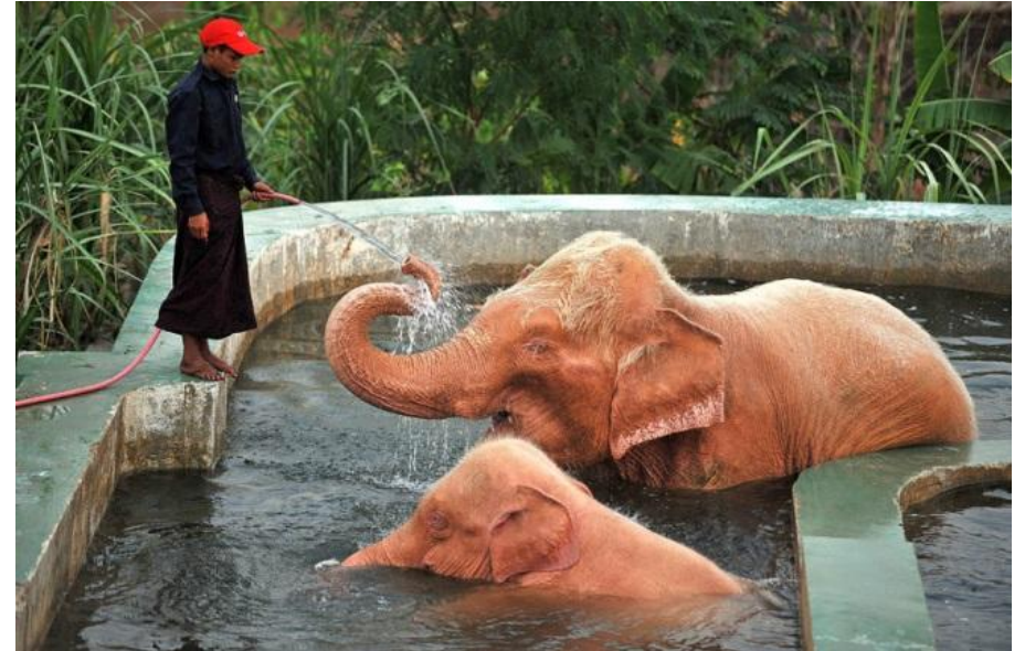
Уникальные розовые слоны Мьянмы