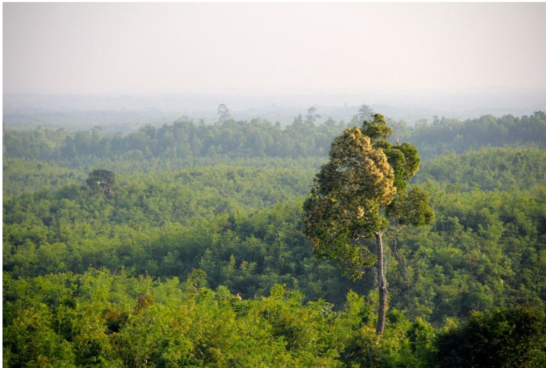
Джунгли в Мьянме