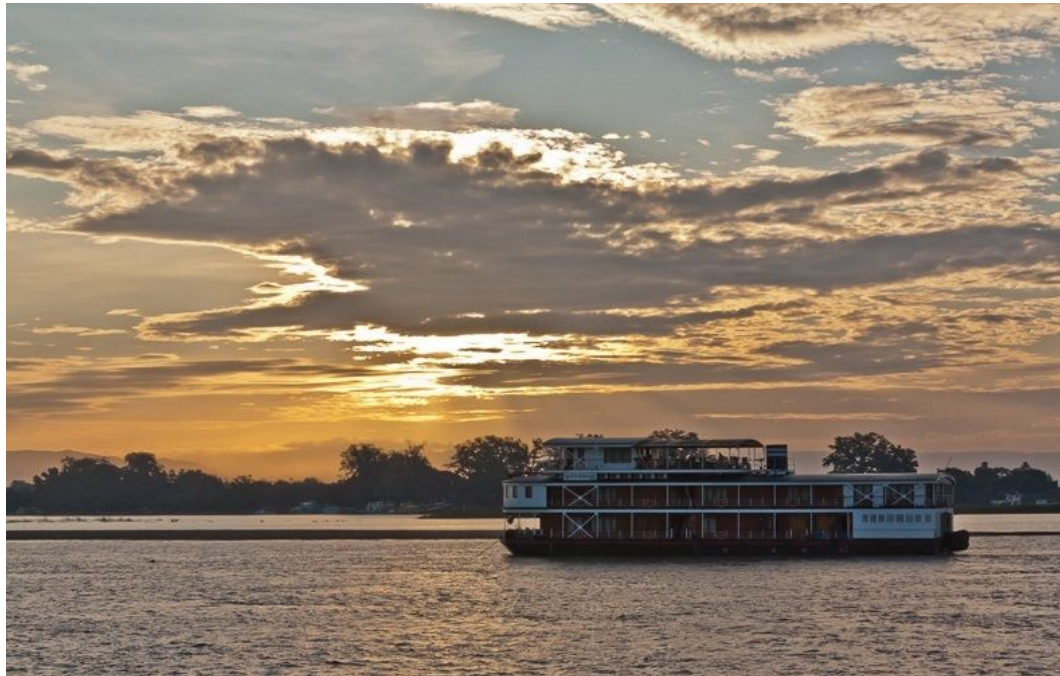
Иравади — крупнейшая река Мьянмы