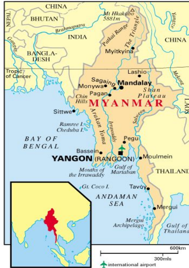
Соседи и положение Мьянмы