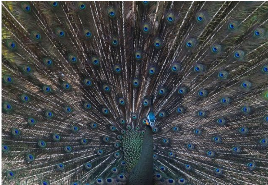
Дикие павлины Мьянмы