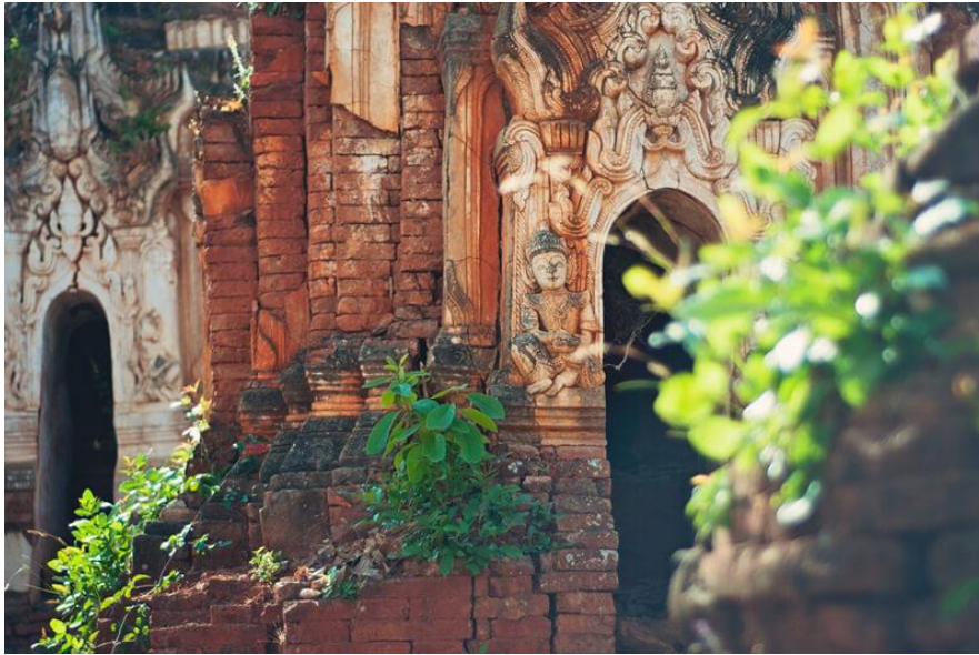
Затерянная храмовая деревня в джунглях Мьянмы