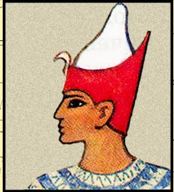
Двойная корона фараонов