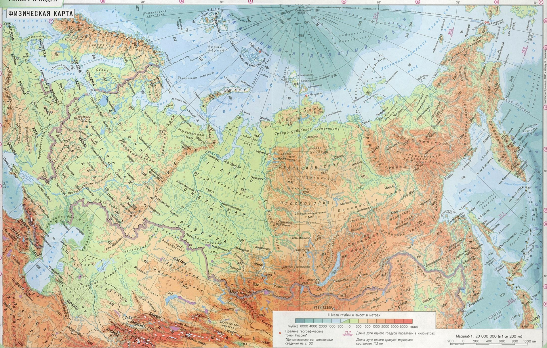
Шкала глубин и высот в метрах

█ 6000 █ 4000 █ 2000 █ 1000 █ 200 █ 0 █ 200 █ 500 █ 1000 █ 2000 █ 3000 █ 5000 █ выше ● Крайние географические точки России*