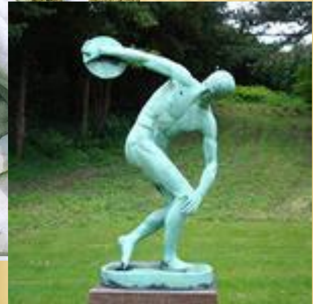
скульптура «Дискоболу» Мирона