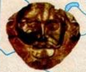
Золота поховальна маска з Мікен