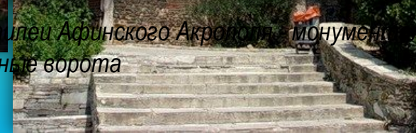
Пропилеи Афинского Акрополя - монументальные входные ворота

http://fotki.yandex.ru/users/nadezda-mini/view/90727?page=0