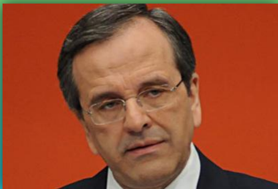
Премьер-министр Греции Антонис Самарас