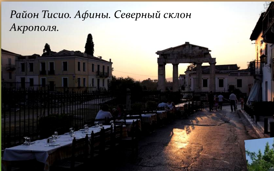
Район Тисио. Афины. Северный склон Акрополя.

http://www.fotomem.ru/blogs/mike/category/athens/