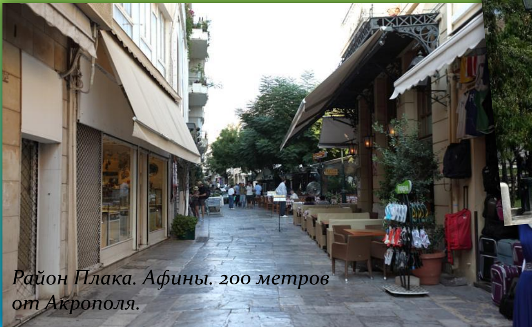
Район Плака. Афины. 200 метров от Акрополя.

Центр Древних Афин располагался вокруг Акрополя, занимал районы Тисио и Плака Эти районы сегодня являются туристическим центром города, вместе с площадью Синтагма .