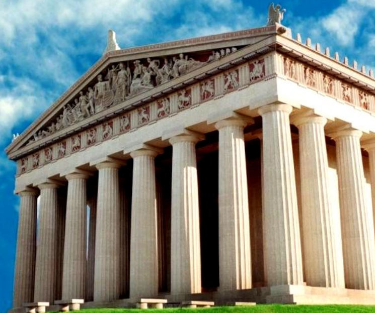
Храм Парфенон в Афинах

http://doseng.org/interesnoe/6015-chudesa-sveta..html