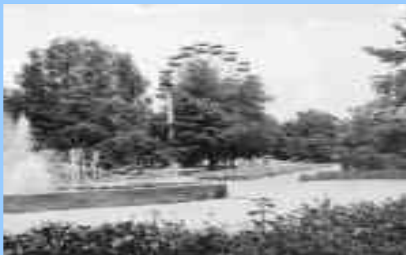
Достопримечательности города Комсомольска – на - Амуре