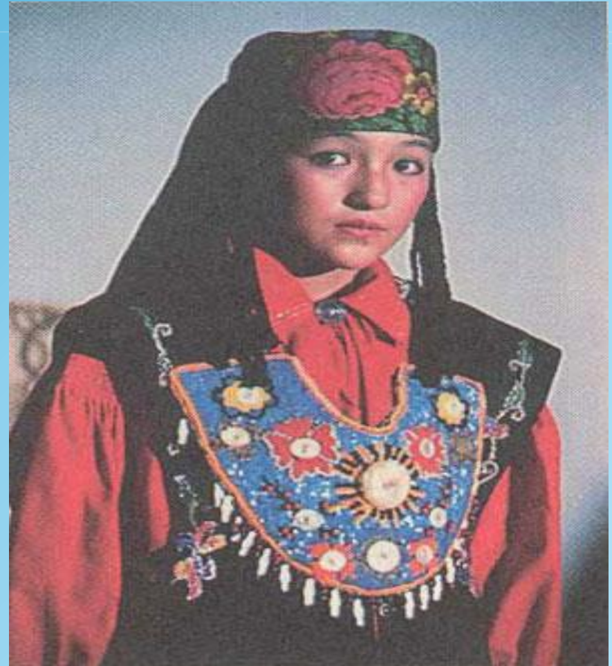
Хакаска в национальной одежде.