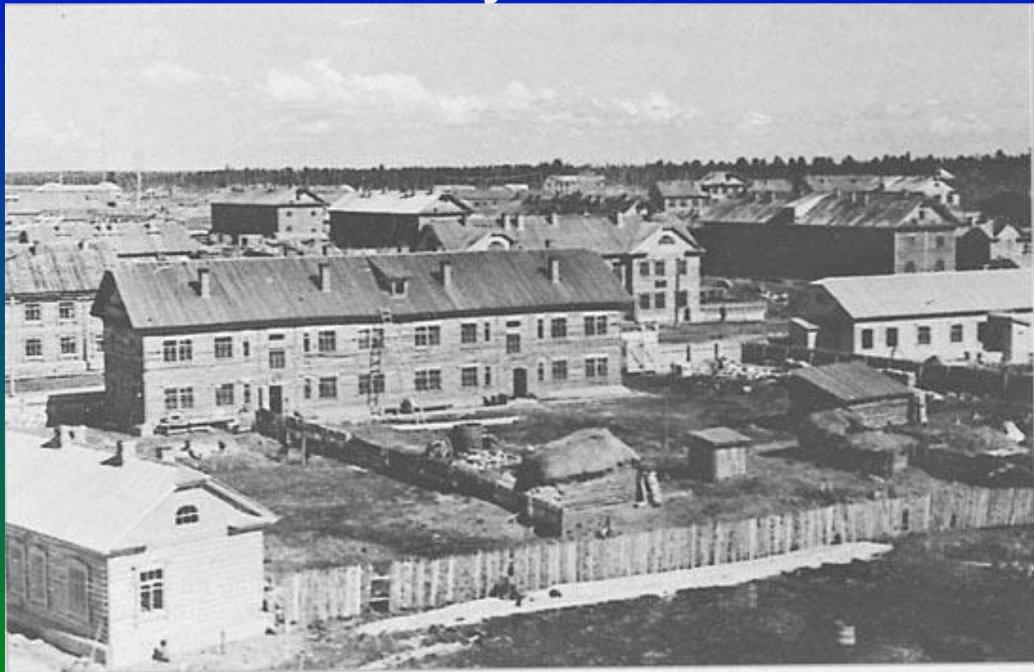
Жилые дома поселка Остяко-Вогульска. 1930-е годы.