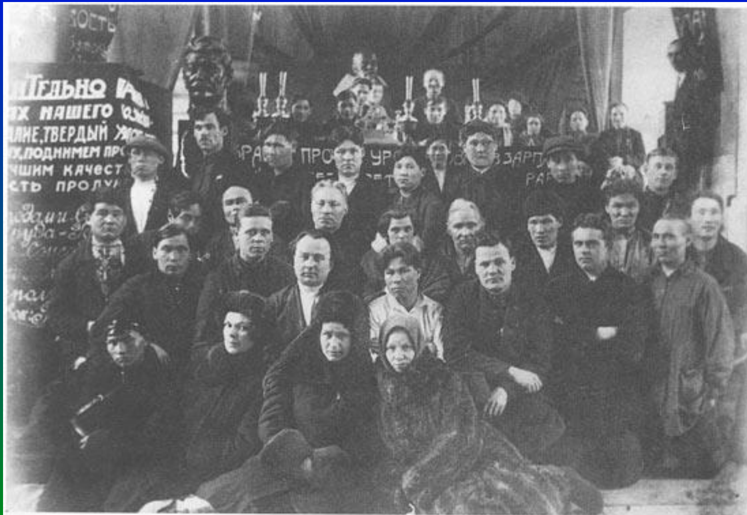
Группа участников первого окружного съезда Советов. Остяко-Вогульск. Февраль-март 1932 г.