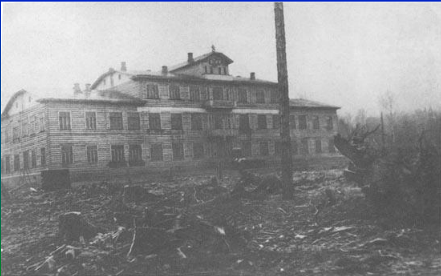
Здание Остяко-Вогульского окрисполкома. Начало 1930-х годов