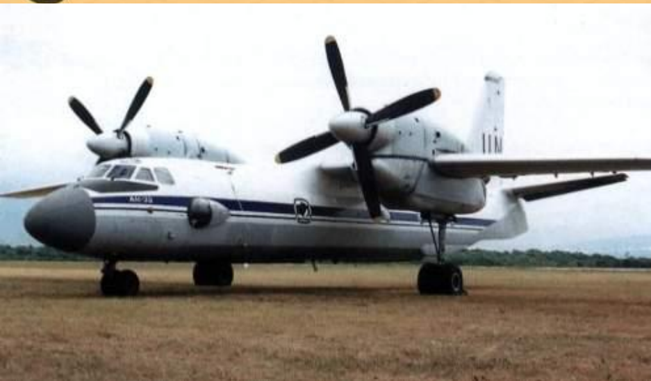
Ан-32. ВВС Индии