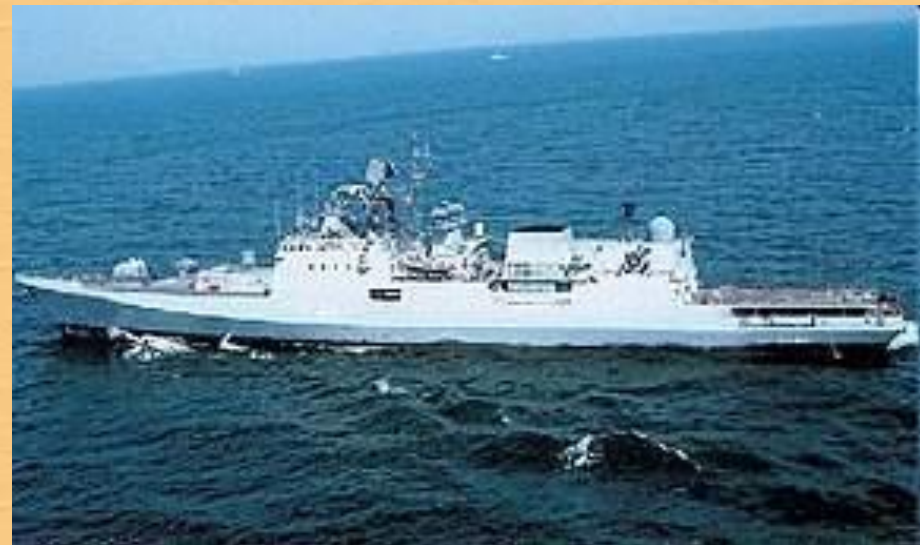
Индийский военный корабль "Табар"