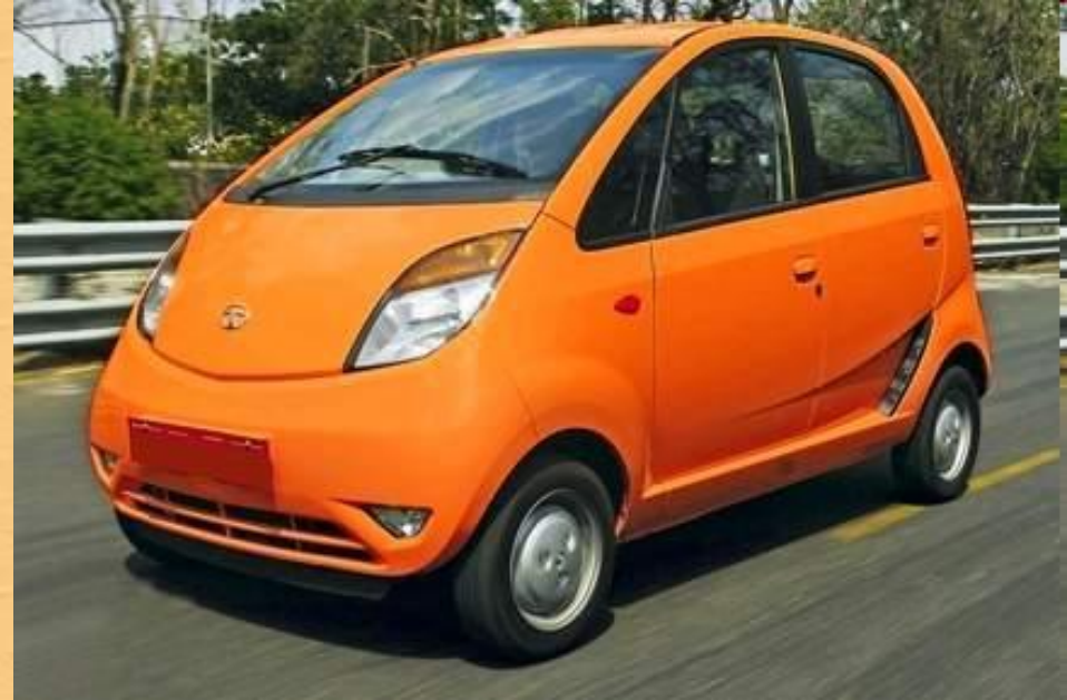
Индийский автомобиль «Tata Nano»

Также развит авиационный, автомобильный, морской и речной транспорт.