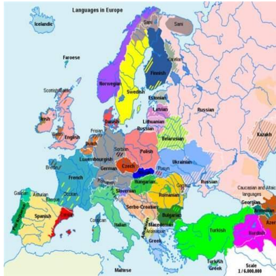
Современная карта Европы