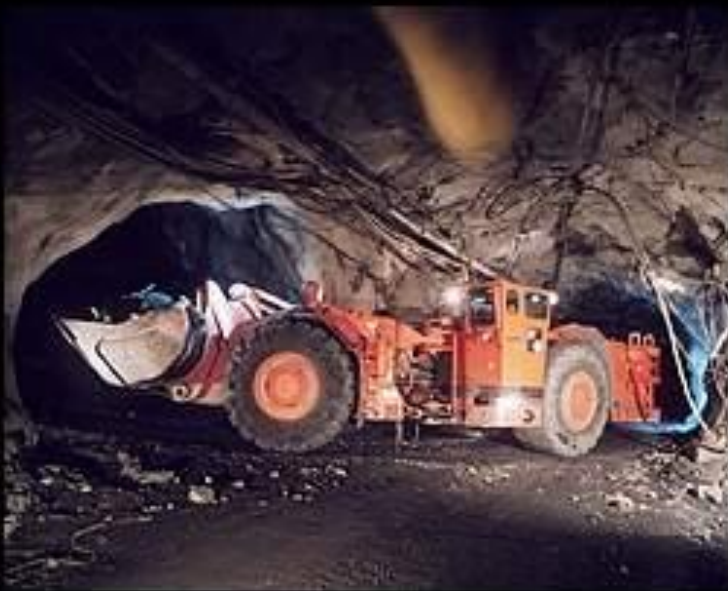
Железорудная пещера в городе Кируна.