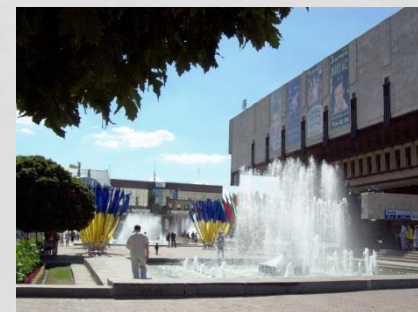
Харьковский Театр оперы и балета