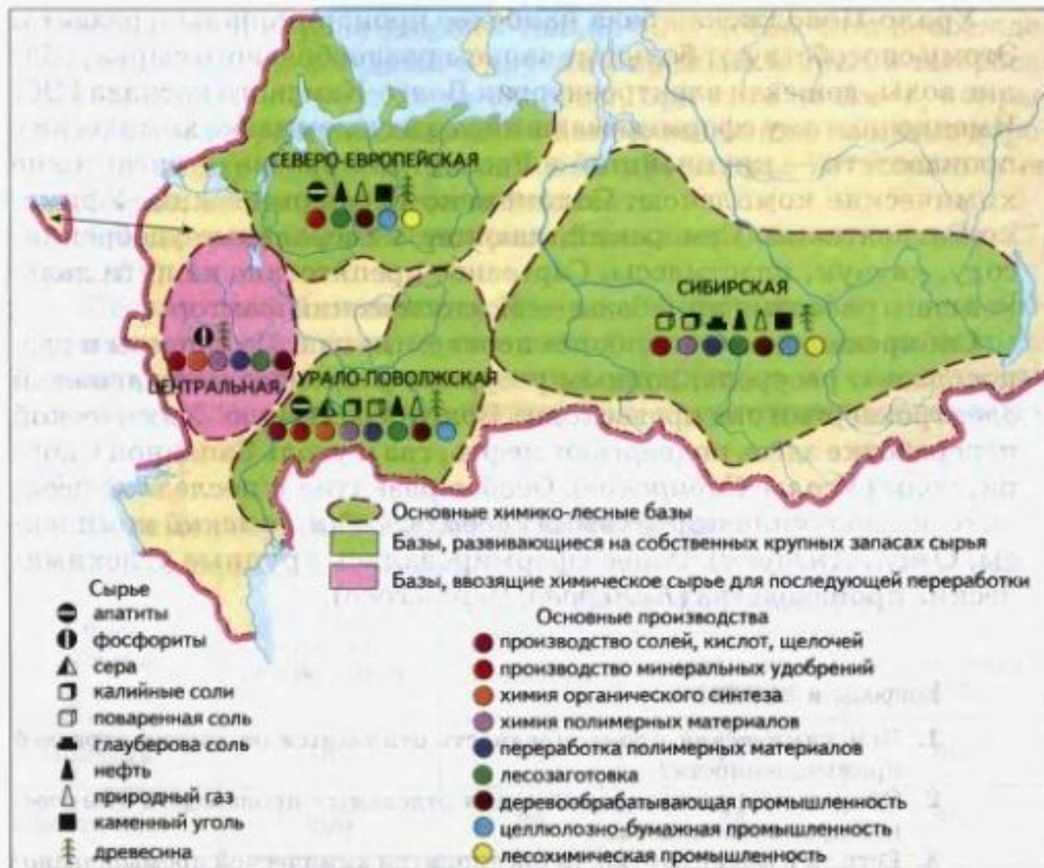
Рис. 50. География химико-лесного комплекса России