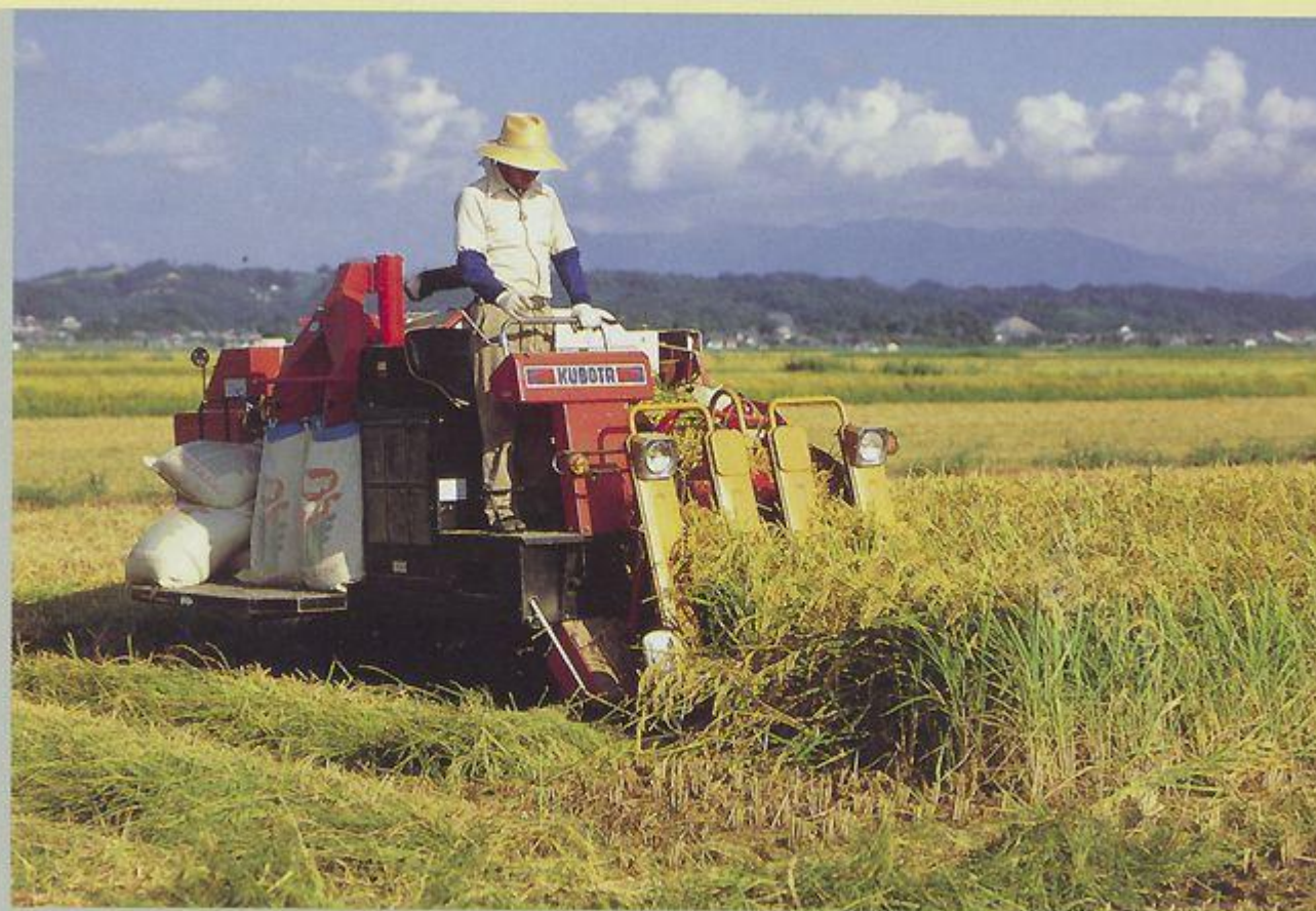
Японский фермер собирает осенний урожай.