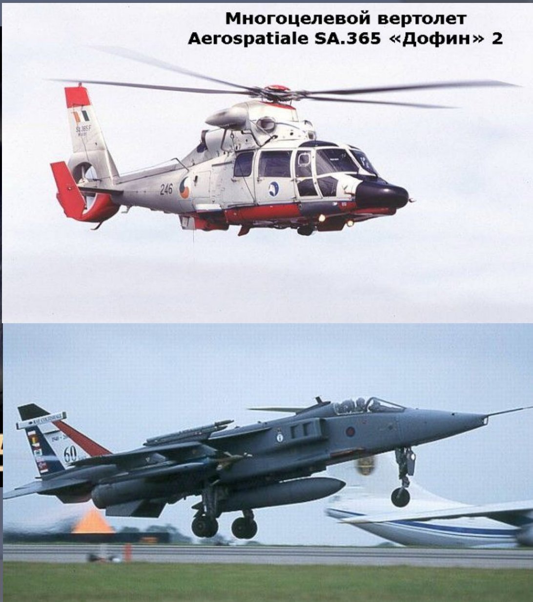
Многоцелевой вертолет Aerospatiale SA.365 «Дофин» 2