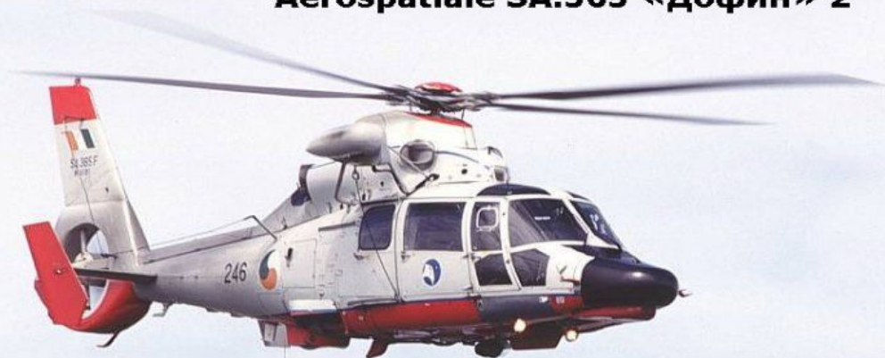
Многоцелевой вертолет Aerospatiale SA.365 «Дюфин» 2