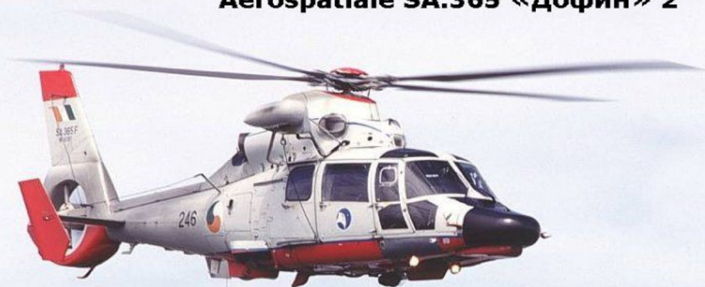
Многоцелевой вертолет Aerospatiale SA.365 «Дофин» 2