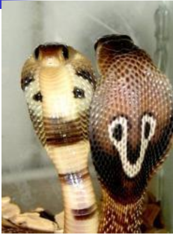
ИНДИЙСКАЯ КОБРА достигает в длину 1,8 м