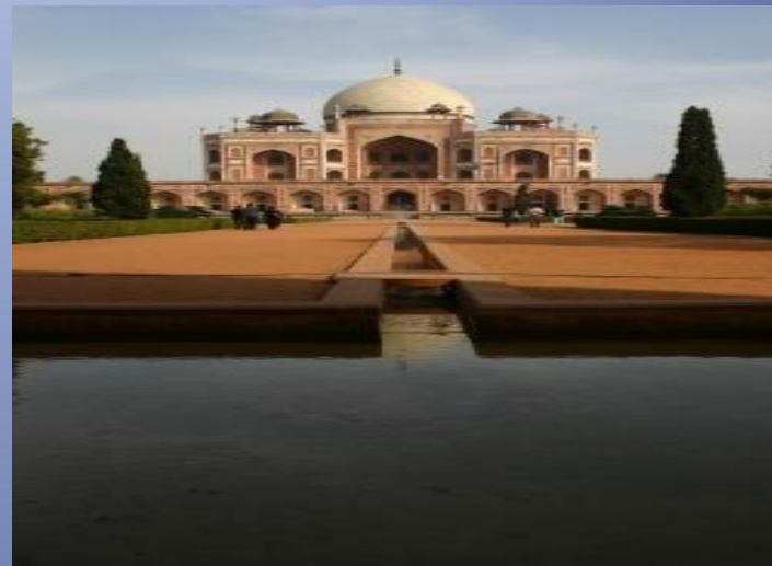
Храм Лакшми - Нараян