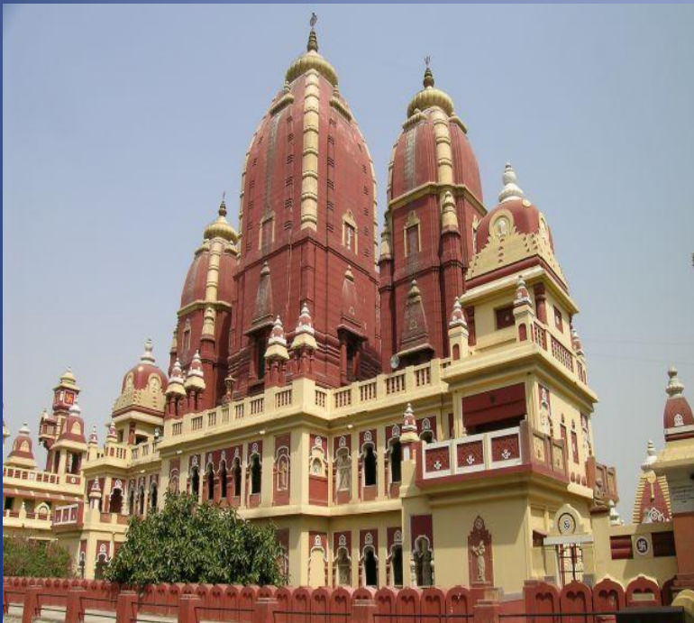
Дом религии Бахал