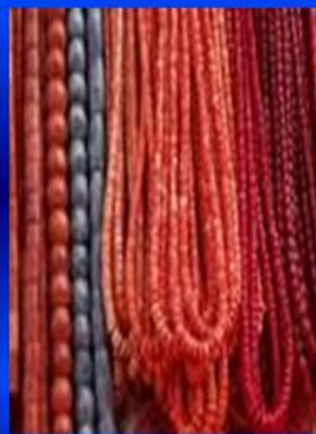
Кораллы и изделия из них