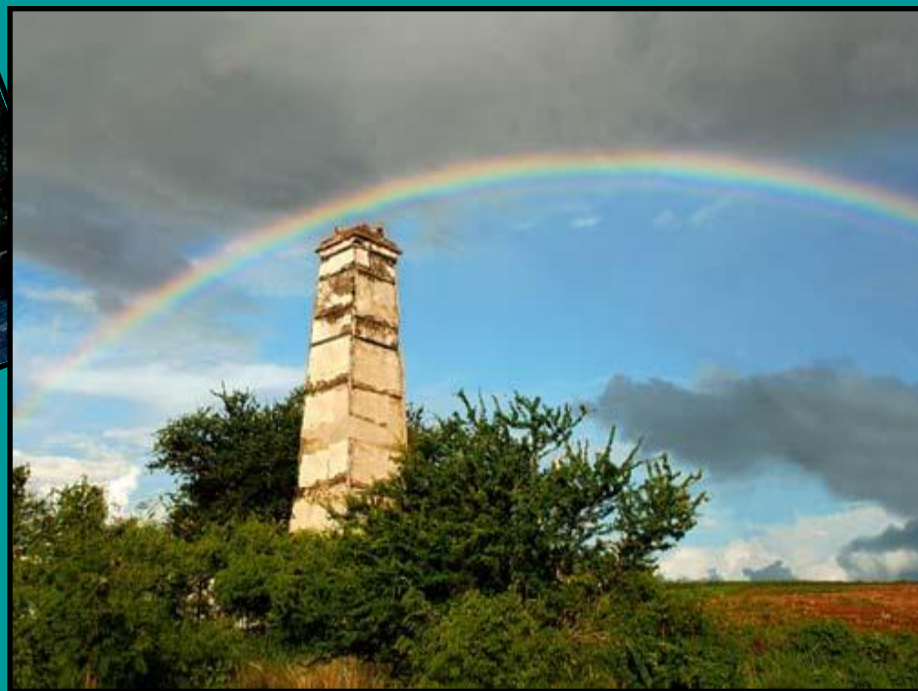
Сахарница Индийского океана – остров Маврикий