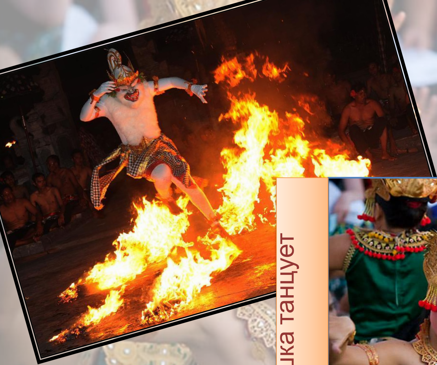
Девушка танцует Кечак