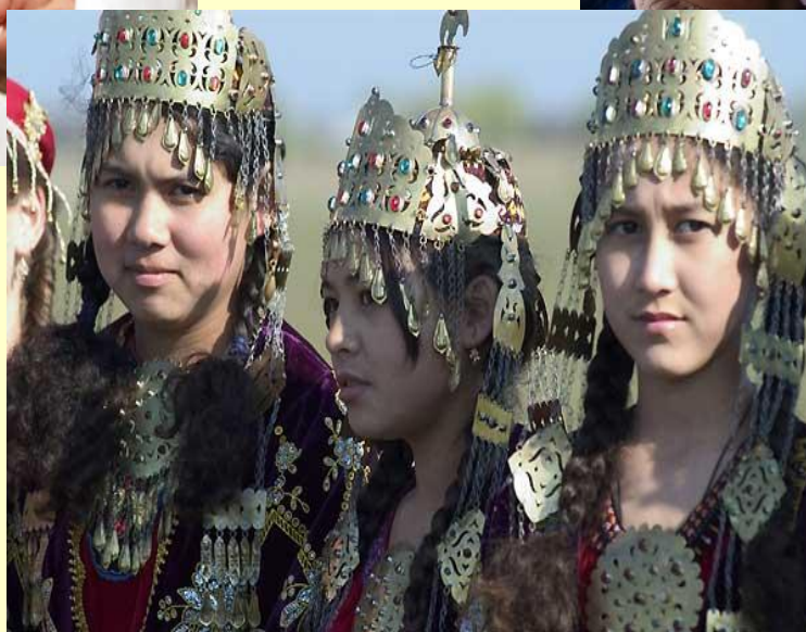
Туркмены, армяне и др. 7%