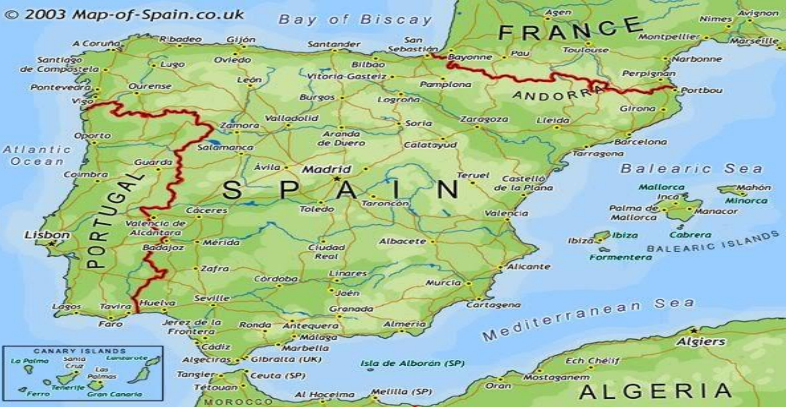
Испания и ее столица Мадрид