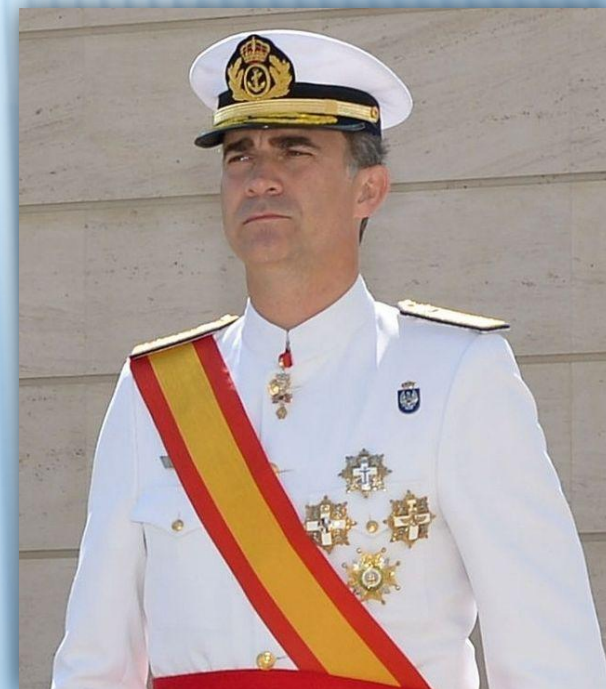
Король Филипп VI