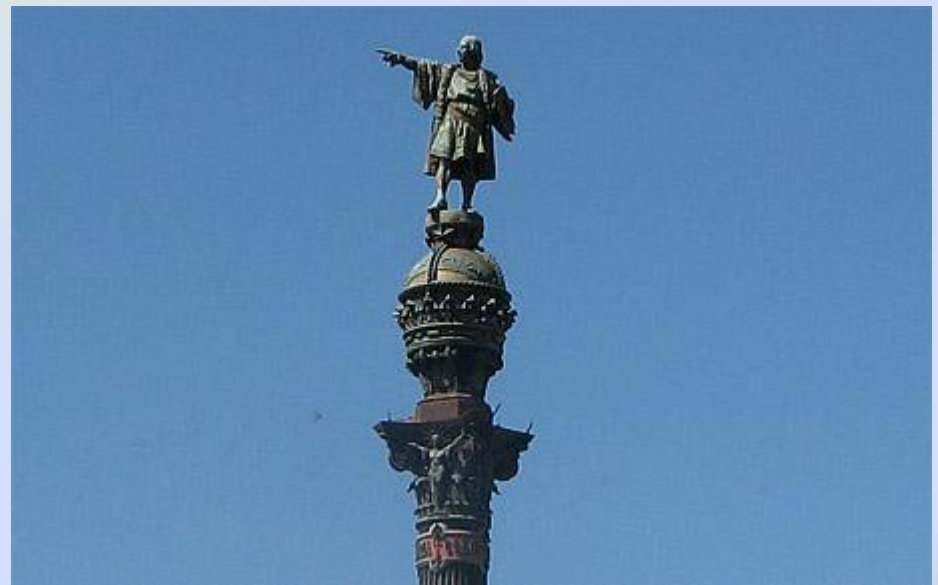
Г Христофору Колумбу