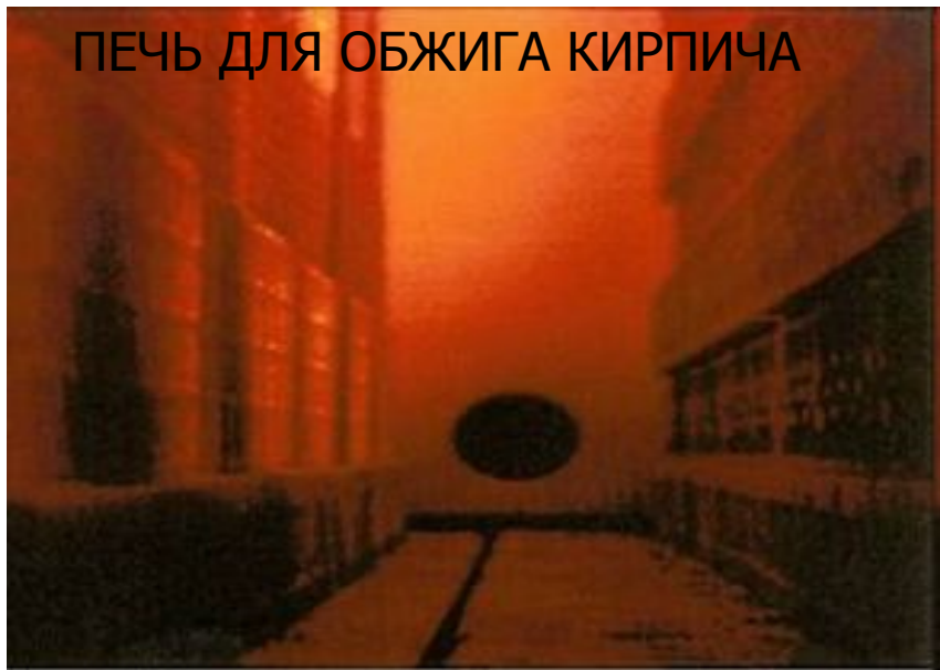
ПЕЧЬ ДЛЯ ОБЖИГА КИРПИЧА