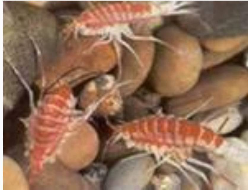
Бокоплавы- рачки, освоившие всю толщу озера.