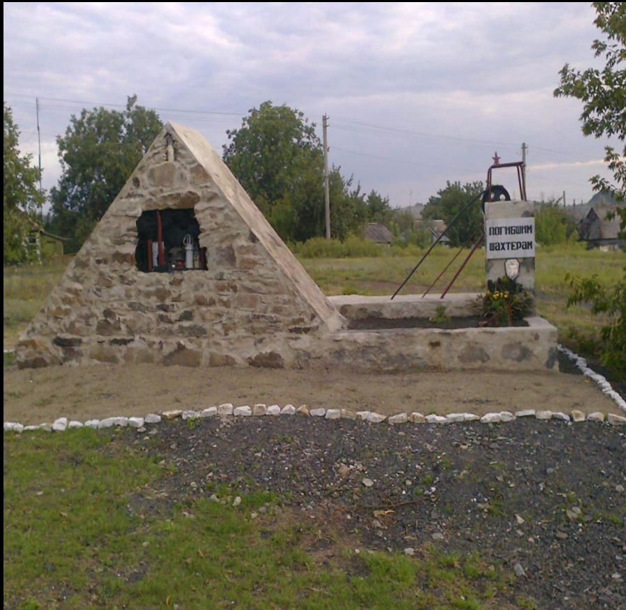
Фото 5 Памятник погибшим шахтерам