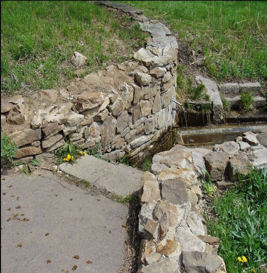
Фото 3 Придорожный родник в р-не колхоза